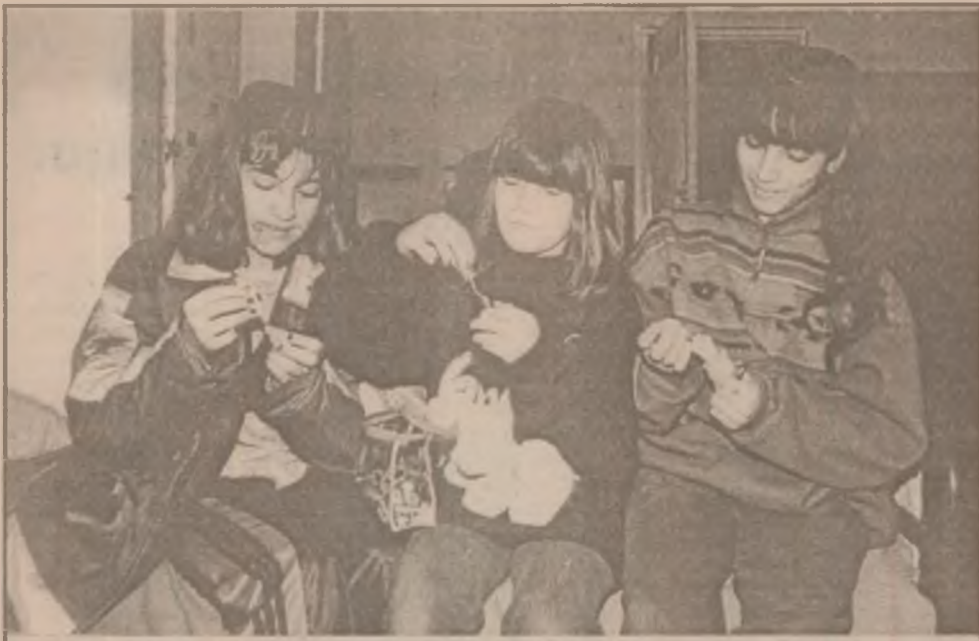
Fetele de la Centrul de Plasament Orăștie sunt cochete, vor să aibă unghii frumoase.

În acest an femeile pot purta ce le place, combinații în funcție de preocupările lor: mini sau lungi, fustele și rochiile pot fi strâmte sau largi, din stoffe metalizate sau transparente. Numitorul comun al acestor veșminte e tendința contrastelor, combinațiile între clasic și sport, elegant și banal. Tendințe noi în modă: cutele inegale puse