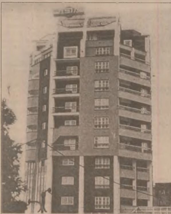
Blocul "CASIAL" din Deva - o construcție ce înnobilează aspectul arhitectonic al orașului

În cazul în care Adunarea Generală nu va fi legal constituită, se va reprograma în data de 26.02.1999, în același loc și la aceeași oră.