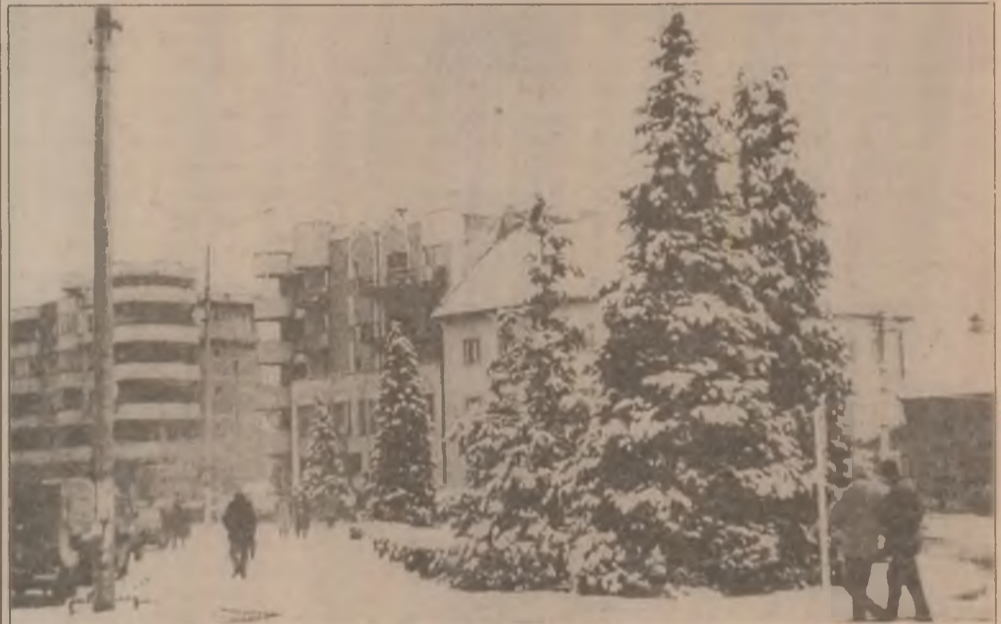
Paisaj de iarnă la Brad