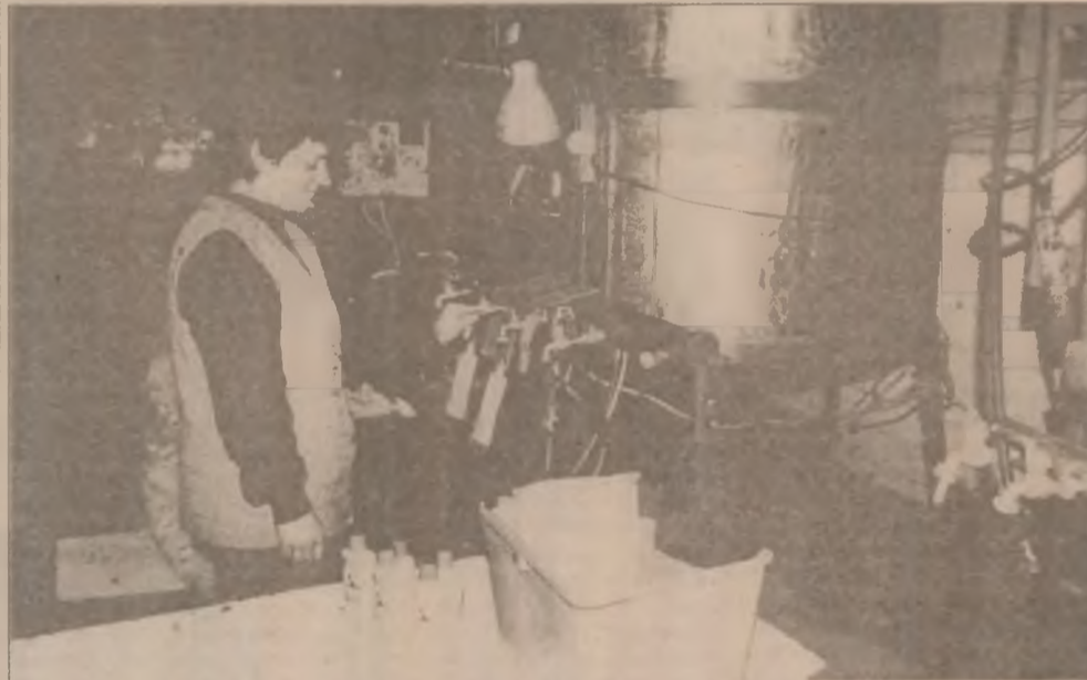
La 17 iulie 1999 la Orăștie a fost înființată prima firmă privată din județ - SC VIGOR PROD IMPEX SRL