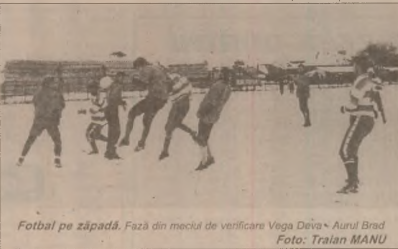
Fotbal pe zăpadă. Fază din meciul de verificare Vega Deva - Aurul Brad

ASA Aurul Brad: Căprărescu, Gomo, Filipaș, Stoica, Neagu, Toderiță, Vereș, Văcaru, Aslău, Lazăr, Achim. Rezerve: Sandu, Mihăilă, Șipoș, Șimon, Lupea, Mursa, Botici, Obârșan, Franeș.