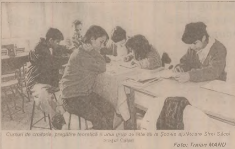
Cursuri de croitorie, pregătire teoretică a unui grup de fete de la Școala ajutătoare Sîrni Săcoi, orașul Călan