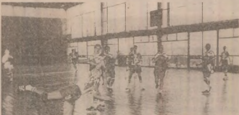
Simona Bozan de la U. Remin Deva într-o fază de atac materializată cu un punct înscris