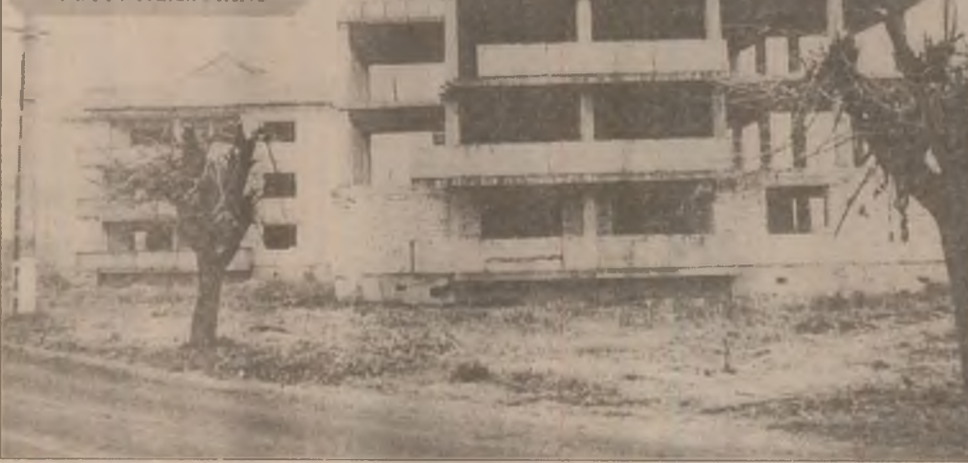
Cele două blocuri începute la Dobra înainte de anul 1989 pentru intelectualii comunei, după atâția ani au rămas în paragina