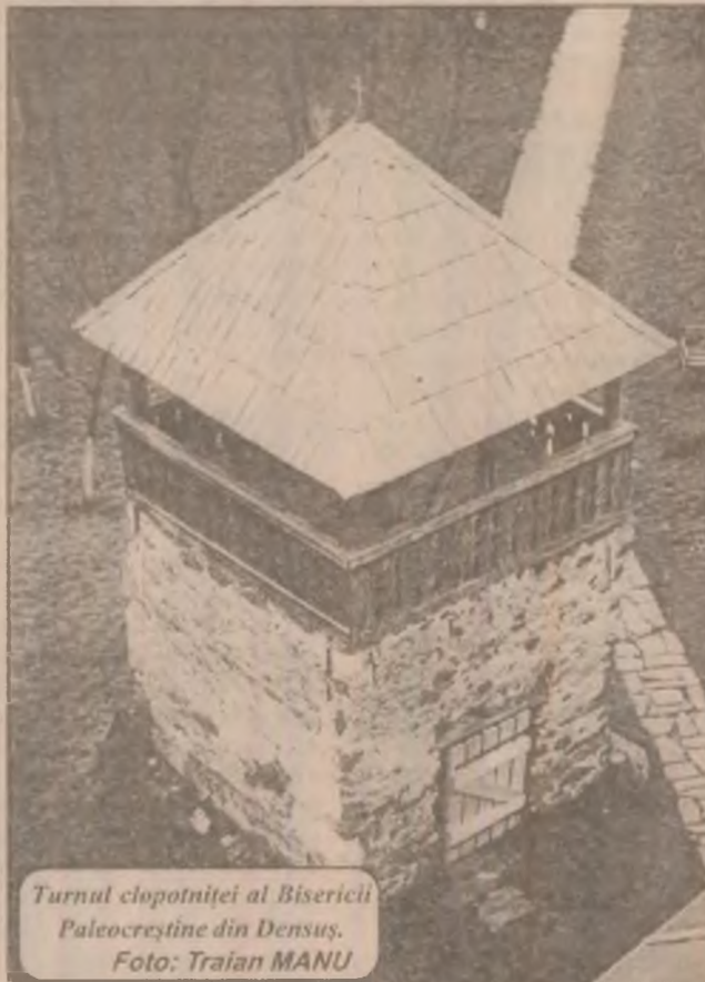
Turnul clopotniței al Bisericii Paleocreștine din Densus.

Pietro, cuprinsă între coloanele lui Bernini, sunt aduși, din diverse țări ale lumii, brazi care sunt plasați lângă Ieslea Sfântă ce închipuie Nașterea Mântuitorului, cu personajele biblice în mărime naturală. Zeci de mii de oameni, italieni și turiști veniți din lumea întreagă, vin în zilele sărbătorilor creștinătății să vadă Piața San Pietro. În ultimii doi ani brazii au fost dăruiți de Polonia și Germania, iar în 1999 și 2000, pomul de Crăciun va fi oferit de Cehia, respectiv Austria.