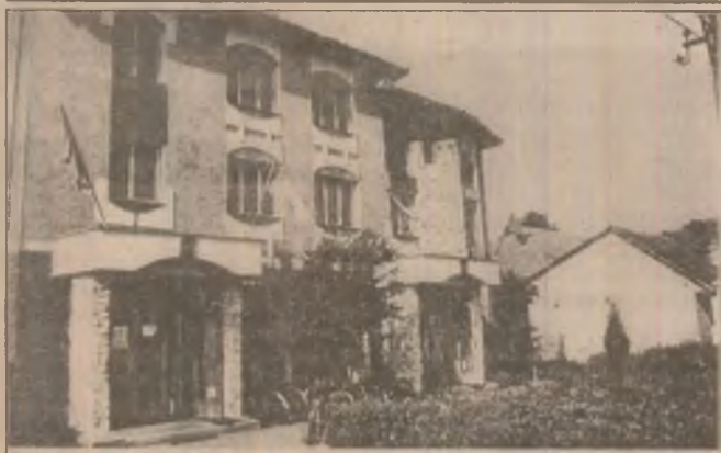
Dispensarul din Branșica - o clădire frumoasă, renovată recent.