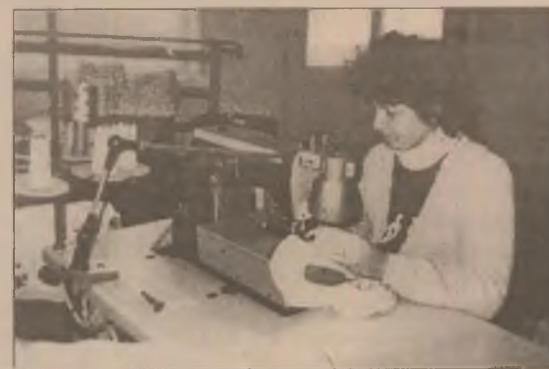
Pentru lucrările de calitate efectuate în anul 1998, SC Fabrica Zarand SA Brad a fost premiată cu "Trofeul pentru calitate" acordat de către o organizație din Madrid a comercianților

De menționat că în anul 1997 Fabricii Zarand SA Brad i s-a atribuit de către o organizație similară din Spania trofeul "Steaua de Aur pentru calitate", fiind o recunoaștere a activității acestei unități. Premiul pentru calitate obținut de către Fabrica Zarand SA Brad se va decerna în 22 martie, la Hotelul "Meridian" din Paris.