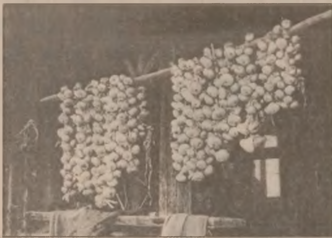
Medicament de... sezon