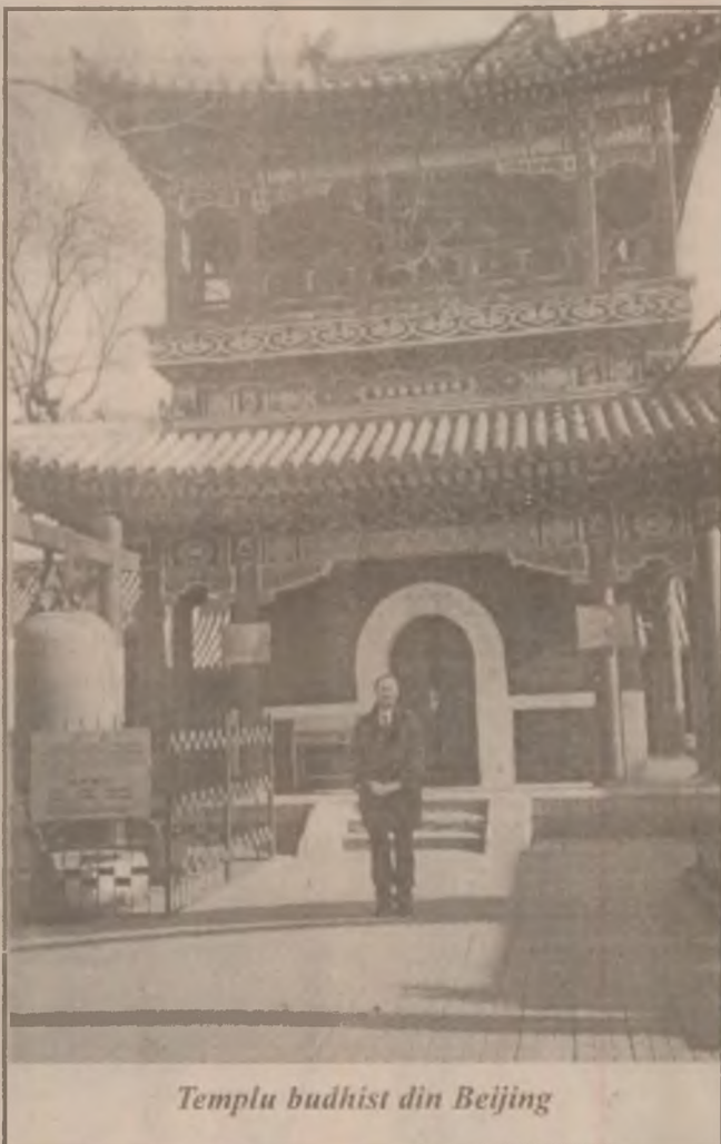
Templu budhist din Beijing

Elevii români au câte 29-33 de ore săptămânal, timpul de studiu în clase fiind foarte apropiat de cel din liceele occidentale.