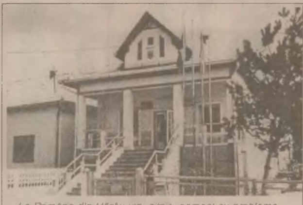
La Primăria din Hârșu viu, zâmbesc oameni cu probleme. Câte se pot rezolva doar consiliul local poate oferi certitudini. Câte nu se pot rezolva știe doar tranziția.

Din păcate, localnicii nu beneficiază de o farmacie, fiind nevoiți să se deplaseze la Orăștie pentru a-și procura medicamentele prescrise de medic, iar dacă medicul le prescrie compensate și gratuite, farmaciile le dau după posibilitățile pe care le au, după cum le-au fost plătite datoriile de către Direcția Sanitară. "Farmaciile au noroc cu furnizorii care le mai dau pe datorie - spunea medicul -, creându-se astfel un lanț al slăbiciunilor." Are însă speranța că se va pune la punct legislația Ministerului Sănătății, în sensul că vor apărea normele de aplicarea a noii legi și se va reglementa astfel întreaga asistență medicală, că o dată ce va demara activitatea Casei de Asigurări Sociale de Sănătate. La data de 1 aprilie a.c., întreaga asistență medicală va cunoaște o îmbunătățire calitativă, serviciile în domeniu vor sălta în mod spectaculos.