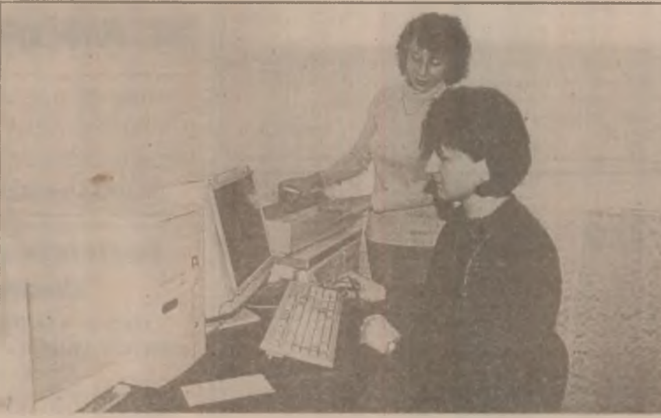
Tehnica de calcul - la mare preț. Și la baza de tratament balnear "Aurel Vlaicu" din Geoagiu Băi, întreaga gestiune financiar-contabilă și administrativă este asistată de calculatoare moderne.

Această facilitate se aplică și contribuabililor care nu au întârziat plata cu mai mult de 10 zile, de trei ori în cursul anului 1999, pentru fiecare obligație în parte, cu condiția ca penalitățile aferente perioadei de întârziere să fie achitate concomitent cu aceste obligații.