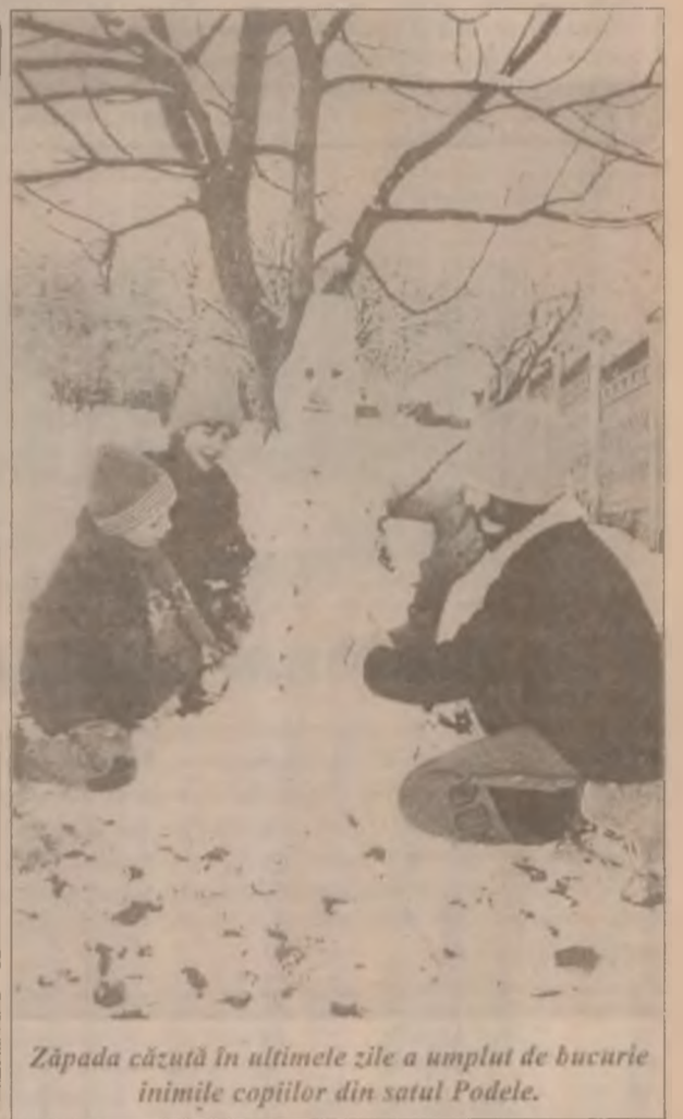
Zăpada căzută în ultimele zile a umplut de bucurie inimile copiilor din satul Podele.

– Păi de aia sunt săraci, că au cumpărat mulți copii!