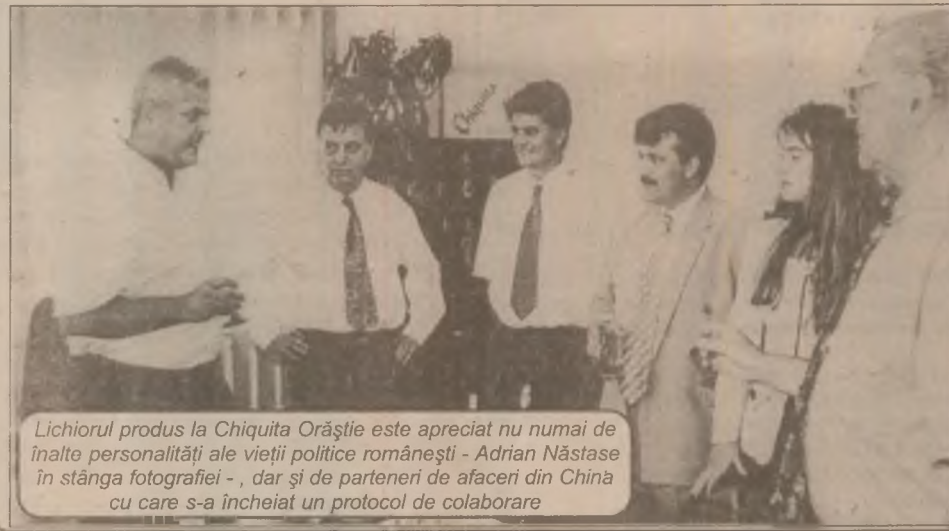
Lichiorul produs la Chiquita Orăștie este apreciat nu numai de înalte personalități ale vieții politice românești - Adrian Năstase în stânga fotografiei -, dar și de parteneri de afaceri din China cu care s-a încheiat un protocol de colaborare

Faptul este remarcabil mai cu seamă din punct de vedere social - situație în care peste 100 de persoane pot dobândi un loc de muncă - având în vedere momentele dramatice prin care trec majoritatea firmelor.