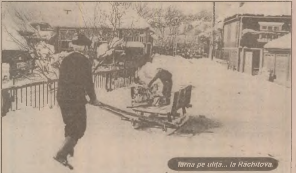
Tarna pe ulița... la Răchitova.