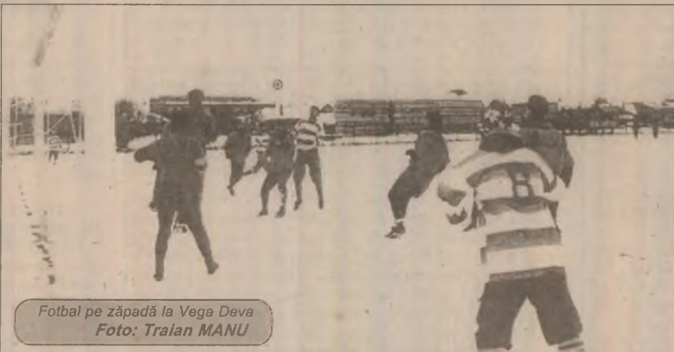
Fotbal pe zăpadă la Vega Deva

În această săptămână, Minerul Certej a reprogramat alte două jocuri amicale de pregătire, după următorul program: miercuri Minerul Certej - Vega Deva iar sâmbătă Minerul Certej - Minaur Zlatna, ambele partide urmând a se desfășura pe stadionul din Simeria.