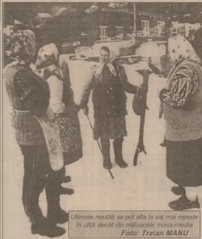
Ultimele noutăți se pot afla în sat mai repede în uita decât din mijloacele mass-media

În conformitate cu prevederile art. 77, pct. 1, litera "a", respectiv art. 78, lit. "b" din Legea 46/1996, neprezentarea tinerilor la comisia de recrutare se sancționează cu amendă de la 500.000 la 3.000.000 lei.