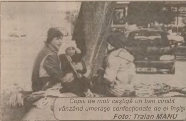
Copiii de moți câștigă un ban cinstit vânzând umerașe confecționate de ei înșiși

5-a, care solicită avort. Trebuie reținut faptul că astfel de avorturi sunt ilegale (perioada legală fiind de până la 3 luni), medicul fiind obligat să le refuze, în caz contrar el este pasibil de pedeapsă. Sunt destul de rare, însă nu au dispărut cu desăvârșire, cazurile în care pacientele își autoprovoacă avortul, folo-