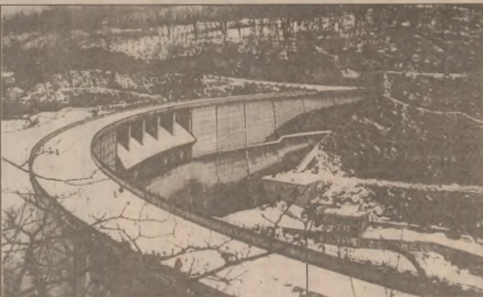
Barajul de acumulare de la Cinciș, locul de unde municipiul Hunedoara se aprovizionează cu apă.