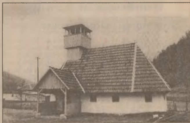
Biserica ortodoxă din Valea Lungă, comuna Vorța, o biserică tot atât de veche precum satul.