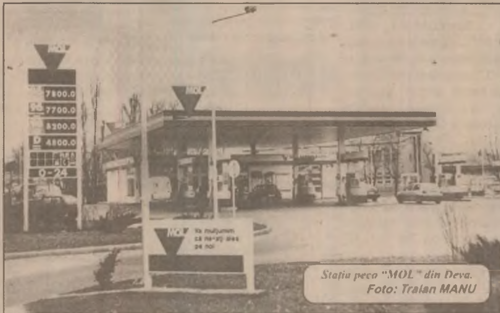
Stația pecc “MOL” din Deva.