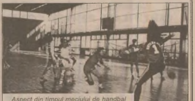
Aspect din timpul meciului de handbal feminin "U" Remin Deva - Artego Tg. Jiu

Tichetele vor fi puse în vânzare la sfârșitul lunii martie de către organizatorii Campionatului European din anul 2000. Câte 400.000 de bilete vor fi repartizate la vânzare liberă și pentru cele 16 participante, 200.000 de bilete vor fi distribuite pentru țările a căror echipă națională nu s-a calificat și pentru diverși parteneri comerciali ai UEFA.