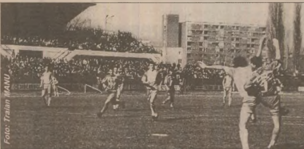
Aspect din timpul meciului de fotbal FC CORVINUL - FC EXTENSIV Craiova, meci încheiat cu victoria hunedorenilor