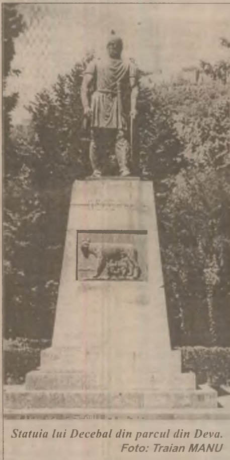
Statuia lui Decebal din parcul din Deva.

Vremea va fi rece îndeosebi în nordul, centrul și estul țării. Cerul va fi variabil în nord-vestul și vestul țării și noros în rest. Local va ninge în Moldova și Transilvania, apoi în Dobrogea și Muntenia. Vântul va avea unele intensificări la munte și va fi în general moderat în regiunile extracarpătice. Temperaturile maxime se vor situa între 0 și 7 grade, iar cele minime între -10 și 0 grade.