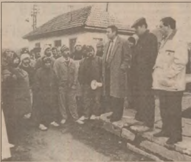
Îngrijorați de soarta întreprinderii și de viața lor, muncitorii de la Secția de industrializare a lemnului Orăștie, din subordinea SC "Sargeția" SA Deva, au organizat, de curând, o nouă manifestație de protest. Din păcate, nimeni nu le aude glasul, nimeni nu le înțelege disperarea...

Până la 31 martie 1999, cele șapte companii miniere vor trebui să transmită prefecturilor și consiliilor județene inventarul cu toate obiectivele susmenționate. După trecerea acestora în patrimoniul autorităților locale, MIC va monitoriza utilizarea eficientă a acestora, care pot fi concesionate sau închiriate anumitor investitori în-baza Legii zonelor defavorizate.