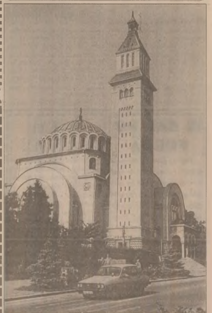
Catedrala din Orăștie, construită între anii 1936-1943, cu hramul Sfinților arhangheli Mihail și Gavril

Trist este faptul că unități private care aveau o bază solidă - Mipa SA Orăștie, spre exemplu -, au disponibilizat în cea mai mare parte personalul datorită situației dificile în care s-a ajuns.