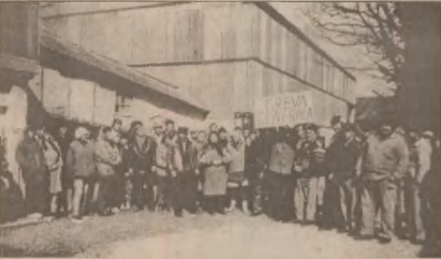
Zile în șir forestierii de la SETIL Orăștie au protestat pentru o viață mai bună și creșterea veniturilor salariale

Aflați în culmea disperării, mai mulți forestieri de la Orăștie sunt dispuși să ceară azil politic în Canada unde sunt locuri de muncă în domeniu "întrucât la noi nu mai există o altă soluție decât șomajul și o viață chinuită, iar în situația în care am ajuns nu ne-a mai rămas altceva de făcut."