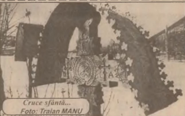
Cruce sfântă...