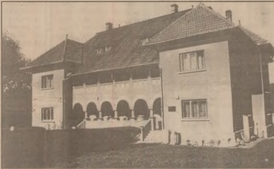
Clădirea muzeului de istorie din Sarmizegetusa.