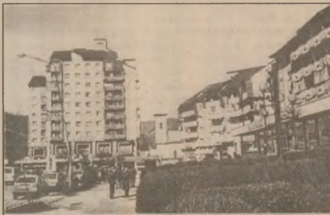
Petroșani. Bulevardul 1 Decembrie.

• Firma "Kaprina" închiriază miei pentru Paști.