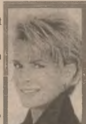
21.00 Diamantele din Harrowhouse

9.00 TVR Cluj-Napoca 10.05 TVR Iași 11.00 TVR Timișoara 12.05 D-na King, agent secret (s) 14.10 Santa Barbara (s/r) 16.00 Emisiune în limba maghiară 17.30 Familia Simpson (s, ep. 30) 18.10 Sunset Beach (s, ep. 429) 19.00 Jumătatea ta (cs) 20.00 Jurnal, meteo, sport, Ediție specială 21.00 Diamantele din Harrowhouse (co. SUA 1974) 22.40 Eclipsa '99 23.10 Jurnalul de noapte. Sport 23.30 Planeta Cinema