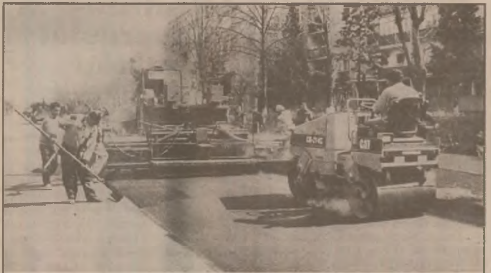
Au început lucrările de înlocuire a asfaltului și pe Bd. Bălcescu din Deva, un bulevard care avea nevoie de o reparație capitală.

Localnicii au acum o situație financiară grea deoarece mulți au fost disponibilizați de la Boita, de la Călan, de la I.A.S. sau de la abatorul hategan. Dar surprinzător este că „birturile merg bine, se extind” deși din cultivarea pământului „nu prea ies venituri”. Din păcate mult mai frecvent oamenii simt nevoia să-și inee amarul într-un pahar decât să se destindă ascultând muzică, urmărind un spectacol. (V.Roman)