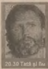
20.30 Tată și fiu

9.00 Prima oră 13.00 Știri 13.10 Atingerea îngerilor (s) 14.05 Celebri și bogați (s) 15.00 Maria Mercedes (s) 16.00 Știri 16.10 Tia și Tamera (s) 16.30 Malcolm și Eddie (s) 18.00 Știri 19.00 Detectivi de elită (s) 20.00 Camera ascunsă (div.) 20.30 Tată și fiu (f.a. SUA '93) 22.00 Frasier (s, ep. 35) 23.00 Ultima ediție (talkshow)