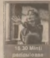
18.30 Minți periculoase

10.00 Trainspotting: Din viață scapă cine poate (co. Anglia 1996) 11.30 Bani (dramă SUA 1995) 13.30 Puiul de urs (co. Franța 1996) 15.00 Abuz de încredere (f.a. SUA 1995) 16.30 Minți periculoase (dramă SUA 1995) 18.15 Jerry Maguire (co. SUA 1996) 20.30 Trauma (thriller SUA 1997) 22.30 Întâlnire cu fiica președintelui (co. SUA 1998) 0.00 Urmărirea (f. dragoste SUA 1998)