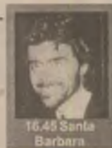
16.45 Santa Barbara

8.25 Palete. Secretele serbării galante 8.55 Documente interzise (do) 9.20 Integrale: The Cure 10.00 Arca lui Noe 11.00 Tenis. România-Croația în Cupa Davis (s) 14.00 Trei familii (s, ep. 2) 14.45 Miniaturi muzicale 16.00 Țiganca (s, ep. 177) 16.45 Santa Barbara (s) 17.30 Un secol de cinema 18.15 Timpul trecut (do) 19.45 Cu cărțile pe față 20.30 Sportmania (mag. sportiv) 23.30 Concert vocal-simfonic