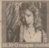
20.30 O noapte ciudată

7.00 Bună dimineața, PRO TV e al tău! 10.00 Tânăr și neliniștit (s/r) 10.45 Alerta (f/r) 13.00 Știrile PRO TV 14.30 Spirit de echipă (s) 16.00 Tânăr și neliniștit (s) 16.45 Cărările iubirii (s) 17.30 Știrile PRO TV/O propoziție pe zi 18.00 Dreptul la iubire (s, ep. 90) 19.30 Știrile PRO TV 20.30 O noapte ciudată (co. SUA '85) 22.15 Știrile PRO TV/Profit 22.30 Dhrama și Greg (s, ep.3) 23.00 Știrile PRO TV 23.15 Audiența națională (talkshow)