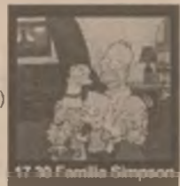
17.30 Familia Simpson

9.00 TVR Cluj-Napoca 10.05 TVR Iași 11.00 TVR Timișoara 12.05 D-na King, agent secret (s/r) 13.00 Pentru dv., Doamnă! (r) 14.10 Santa Barbara (s/r) 17.00 Timpul Europei 17.30 Familia Simpson (s, ep. 32) 18.10 Sunset Beach (s, ep. 430) 19.00 Jumătatea ta (cs) 20.00 Jurnal. Meteo. Sport. Ediție specială 21.00 Ivanhoe (s, ep. 5) 21.55 La volan. Informații rutiere 22.05 Cu ochii-n 4 23.05 Jurnalul de noapte. Sport 23.20 Dintre sute de catarge