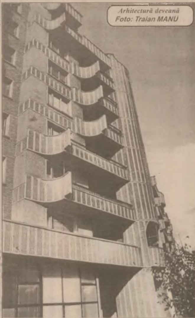
Arhitectură deosebită

Lapidus mărturisește că majoritatea clientelei îi vine din Orientul Mijlociu, Arabia Saudită și Emiratele Arabe. "Scopul lor este de a fi recunoscute ca femei care se îmbracă haute couture", crede Laila Aram, directoare de vânzări. Una dintre cele mai constante clientele este o tânără din Arabia Saudită, care se îmbracă de la casa Lapidus de când avea 12 ani.