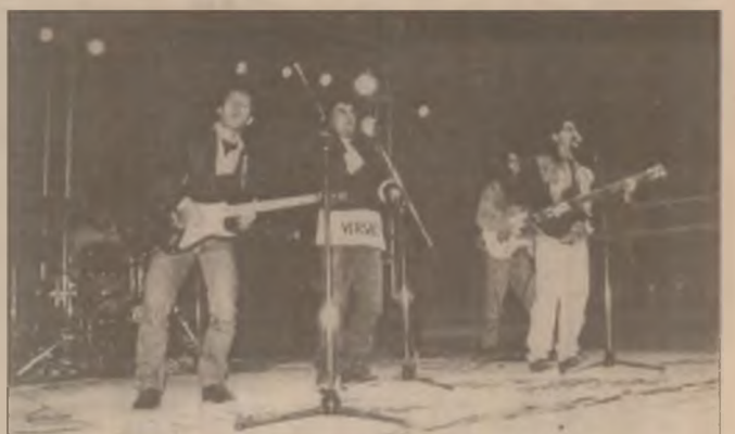
Formația de muzică rock "Echinox" din Orăștie