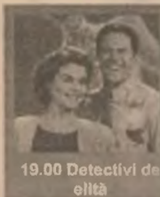
19.00 Detectivi de elită

10.00 Tia & Tamera 10.30 Malcolm & Eddie 11.00 Gregory Hines Show 11.30 Lumea lui Dave (s) 12.00 Legături de familie 12.30 Povești de iubire 14.00 Cinemagia 14.30 Duminică la Cinema 18.00 Știri 18.30 Camera ascunsă 19.00 Detectivi de elită 20.00 Viață de erou (dramă, SUA, 1988-1989) 22.00 Frasier (ep. 36) 22.30 Știri 23.00 Întoarcere de pe tărâmul morții (thriller, SUA, 1989)