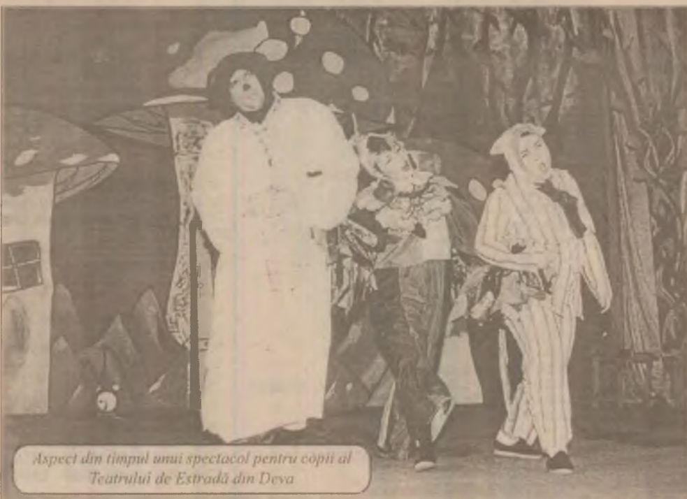
Aspect din timpul unui spectacol pentru copii al Teatrului de Estradă din Deva