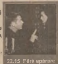
22.15 Fără apărare

10.00 Unde-s doi... (comedie romantică SUA 1995) 11.45 Braconierul (thriller, SUA 1996) 13.30 Doamna Winterbourne (comedie romantică, SUA 1996) 15.15 Căuză dreaptă (suspans, SUA 1995) 17.00 Cum și-e scris (comedie romantică SUA 1994) 18.45 Crimă la Nr. 1600 (acțiune, SUA 1997) 20.30 Nouă luni (comedie, SUA 1995) 22.15 Fără apărare (dramă, suspans, SUA 1996) 0.15 Băieți răi (comedie, SUA, 1995)