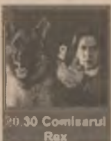
20.30 Comisarul Rex

9.00 Prima oră 13.00 Știri 13.10 Atingerea îngerilor (s) 14.05 Celebri și bogați (s) 15.00 Maria Mercedes (s) 16.00 Știri 16.10 Tia și Tamera (s) 16.30 Malcolm și Eddie (s) 18.00 Știri 19.00 Detectivi de elită (s) 20.30 Comisarul Rex (s, ep. 19) 21.30 Gardă de corp (s, ep. 6) 22.30 Știri 23.00 Ultima ediție (talkshow)