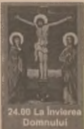
24.00 La învierea Domnului

8.30 Documentar 9.00 Cronica Africii Sălbatică 9.30 Arca lui Noe 11.25 TVR Iași 13.30 Creanga de aur 14.00 Trei familii (ep. 4) 14.45 Poem bizantin 16.00 Grecia (ep. 3) 16.50 Santa Barbara (ep. 823) 17.35 Tradiții 17.55 Rugby: Țara Galilor-Anglia 19.40 Reîntâlnire cu Placido Domingo 20.40 Sportmania 24.00 La învierea Domnului