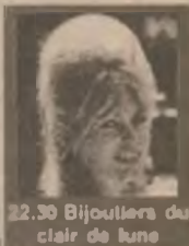
22.30 Bijutieri du clair de lune

7.00 - 12.15 Filme și seriale (reluări) 14.15 Marimar (s, ep. 61) 15.00 Surorile (s/r) 16.00 Guadalupe (s, ep. 166) 17.00 Viața noastră (s, ep. 29) 18.00 Dragoste și putere (s, ep. 343) 18.45 Înger sălbatic (s) 20.15 Celeste se întoarce (s, ep. 55) 21.00 Minciuna (s, ep. 15) 21.45 Surorile (s, ep. 80) 22.30 Bijutieri du clair de lune (dramă Franța/Italia 1958)