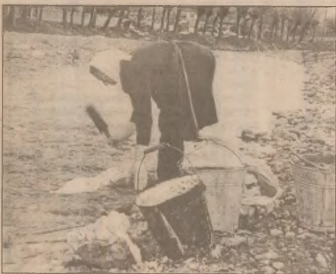
Marioara Corobea din Boșorod își spală hainele prin metode tradiționale.