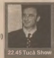
22.45 Tucă Show

6.45 Dimineata devreme 10.00 Știri 10.20 Cafea cu parfum de femeie (s) 11.10 Să fii cel mai bun (s, ep. 2) 13.00 Știrile amiezii 13.30 Esmeralda (s, ep. 19) 15.20 Trei destine (s, ep. 122) 16.05 Ape liniștite (s) 17.00 Știri 17.25 Camila (s, ep. 4) 19.00 Observator 20.00 Trecut salvator (f.a SUA '96) 21.30 Obsesii virtuale (I) (SF, 1992) 22.15 Observator 22.45 Tucă Show