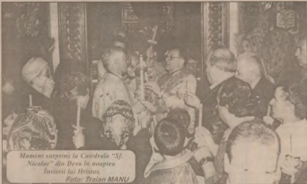
Moment surprins la Catedrala "Sf. Nicolae" din Deva în noaptea Învierii lui Hristos.

Din 1990 până în prezent, Asociația Caritas din Unna, Germania, a mai fost prezentă la Deva încă de trei ori cu ajutoare pentru cei nevoiași, valoarea totală, numai a ultimului transport, fiind de aproximativ 2.000 de mărci. (C.P.)