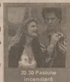
20.30 Pasiune incendiară

20.00 Foamea (s) 20.30 Pasiune incendiară (co. SUA 1991) 22.15 Asalt strategic (f.a. SUA 1998) 23.45 Rămășițele zilei (dramă SUA 1993)