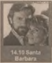
14.10 Santa Barbara

12.05 Căsuța din prerie (s/r) 13.00 TVR Craiova 14.10 Santa Barbara (s/r) 15.00 Tradiții 15.30 Mapamond 16.00 Emisiune în limba maghiară 17.30 Familia Simpson (s.d.a. ep. 41) 18.10 Sunset Beach (s, ep. 439) 19.00 Jumătatea ta (cs) 20.00 Jurnal. Meteo. Sport 21.00 Primul val (s, ep. 19) 21.50 Teatrul TV prezintă: Nimic despre Hamlet 23.25 Jurnalul de noapte. Sport 23.40 Scena