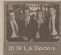
20.30 L.A. Doctors

10.00 Știri 10.20 Cafea cu parfum de femeie (s) 11.30 Un pontif la București (do) 12.00 Un act de voință (s, ep. 3) 13.00 Știrile amiezii 13.15 Esmeralda (s, ep. 25) 14.00 Foișorul de foc (talkshow) 15.00 Trei destine (s, ep. 128) 16.10 Ape liniștite (s, ep. 29) 17.00 Știri 17.25 Camila (s, ep. 31, 32) 19.00 Observator 20.00 Prezentul simplu 20.30 L.A. Doctors (s, ep. 2) 21.20 Cronici paranormale (s) 22.15 Observator 22.45 Tucă Show