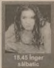
18.45 Înger sălbatic

7.00-12.15 Seriale și filme (reluări) 14.15 Marimar (s) 15.00 Surorile (s/r) 16.00 Guadalupe (s) 17.00 Viața noastră (s) 17.50 Dragoste și putere (s) 18.45 Înger sălbatic (s) 19.30 Căsuța poveștilor: Flipper (s) 20.15 Celeste se întoarce (s) 21.00 Minciuna (s) 21.45 Surorile (s) 22.45 He's Not Your Son (dramă SUA 1984) 00.30 Hat-Trick 02.00 Doctor în Alaska (ep. 13)