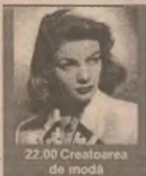
22.00 Creatoarea de modă

9.00 TVR Cluj-Napoca 10.05 TVR Iași 11.00 TVR Timișoara 12.05 Căsuța din prerie (s/r) 13.00 Conviețuirii... 13.30 De la lume adunate... 14.10 Santa Barbara (s/r) 15.00 Ecoturism 15.30 Emisiune în limba germană 17.00 Ceaiul de la ora 5 (div.) 19.00 Jumătatea ta (cs) 20.00 Jurnal, meteo, sport. Ediție specială 22.00 Creatoarea de modă (co. SUA 1957)