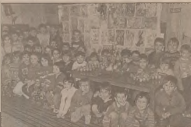
Copiii Grădiniței cu program normal nr. 3 Brad, la Sfintele sărbători de Paști.