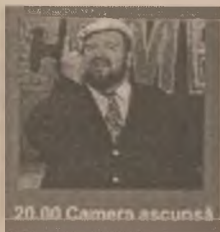
20.00 Camera ascunsă

7.00 Ultima ediție (r) 9.00 Prima oră 12.00 În căutarea dreptății (s) 13.00 Atingerea îngerilor (s) 14.00 Celebri și bogați (s) 15.00 Maria Mercedes (s) 16.00 Tia și Tamera (s) 16.30 Malcolm și Eddie (s) 17.00 Jerry Springer Show 18.00 Știri 18.50 Real TV 19.00 Detectivi de elită (s) 20.00 Camera ascunsă (div.) 20.30 Comisarul Rex (s, ep. 21) 21.30 Gardă de corp (s, ep. 8) 22.30 Știri