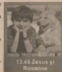
13.45 Zeus și Roxanne

10.00 Robersonii și poliția (co. SUA '94) 11.30 Franklin: „Grăbește-te, Franklin!” (d.a) 12.00 Camioane ucigașe (horror SUA 1993) 13.45 Zeus și Roxanne (co. SUA 1996) 15.30 Războiul fiarelor 16.00 Robin Hood, prințul hoților (f.a SUA 1991) 18.30 Banii (dramă SUA 1995) 20.30 Echipa specială (thriller SUA 1998) 22.15 Nouă luni (co. SUA 1995)