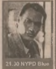
21.30 NYPD Blue

7.00 Bună dimineața, PRO TV e al tău! 10.00 Tânăr și neliniștit (s/r) 11.00 Desert Gamble (f/r) 13.00 Știrile PRO TV 13.05 Hercule (s) 13.45 Xena, prințesa războinică (s) 14.30 Spirit de echipă (s) 15.00 Galactica (s) 16.00 Tânăr și neliniștit (s) 16.45 Cărările iubirii (s) 17.30 Știrile PRO TV 18.00 Dreptul la iubire (s) 18.45 Știrile PRO TV 19.30 Știrile PRO TV 20.30 Aventura (s, ep. 10) 21.30 NYPD Blue (s, ep. 58) 22.15 Știrile PRO TV 22.30 Susan (s, ep. 10) 23.00 Știrile PRO TV / Profit 23.30 Profesiunea mea, cultura