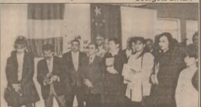
Aspect din timpul vernisajului expoziției de artă fotografică "China în imagini" deschisă la Deva