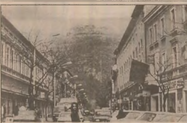
Deva. Centrul vechi.