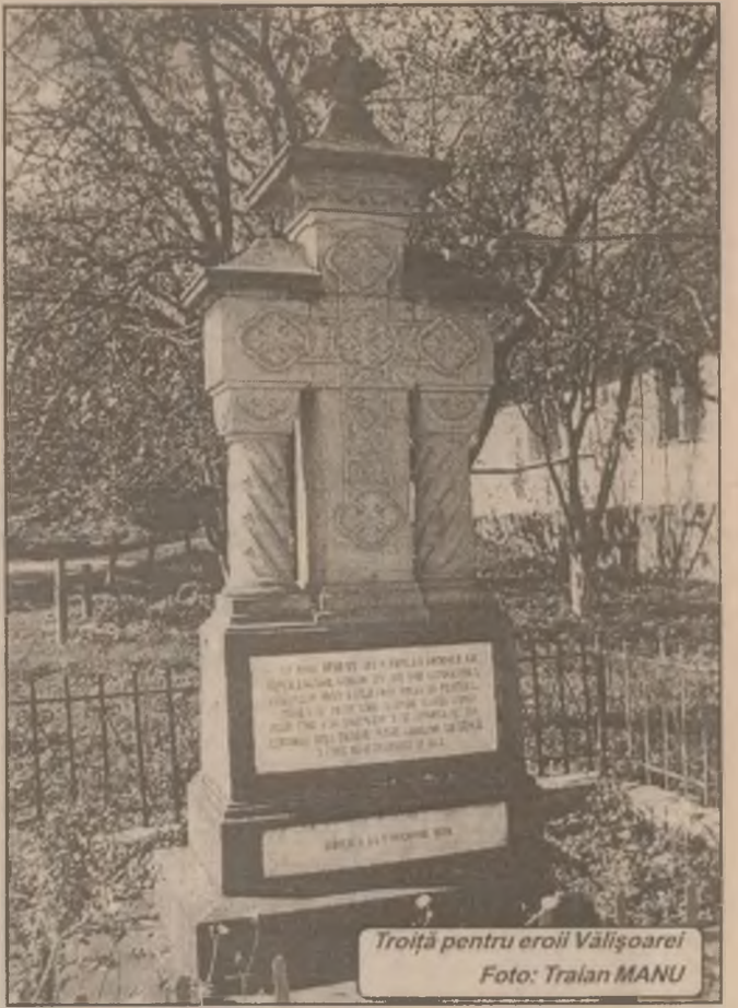
Troită pentru eroii Vălișoarei

Victima a căzut în râu și a fost găsită în aval la circa 5 km de la locul faptei. (V.N.)