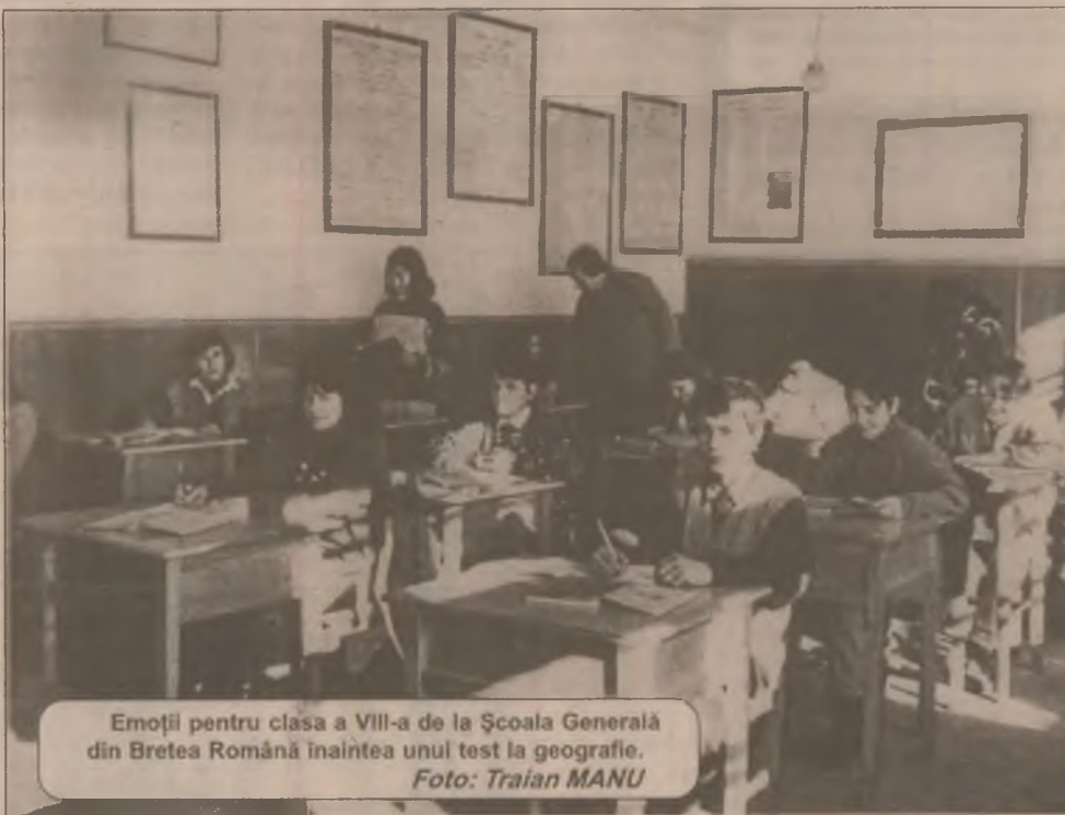
Emoții pentru clasa a VIII-a de la Școala Generală din Bretea Română înaintea unui test la geografie.