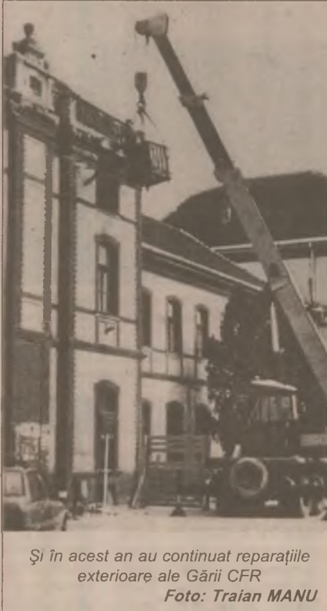
Și în acest an au continuat reparațiile exterioare ale Gării CFR

Alocarea pentru bugetul local numai a unei cote părți din impozitul pe salarii va crea mari dificultăți în realizarea sumelor planificate, întrucât numărul salariaților este în scădere, iar veniturile acestora sunt relativ mici, s-a mai opinat de către viceprimarul Simeriei.