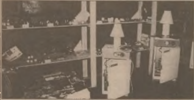
Instantaneu din interiorul magazinului "Urban Construct"