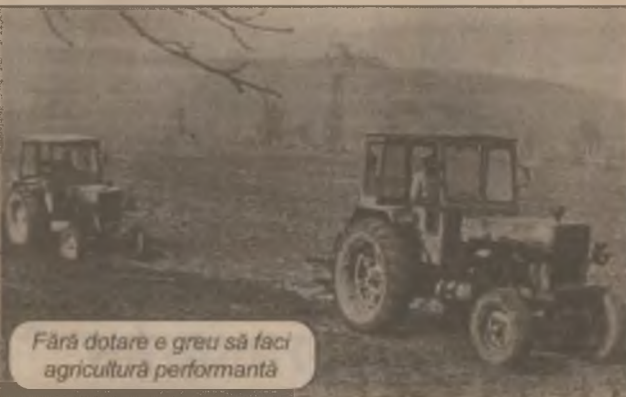
Fără dotare e greu să faci agricultură performantă