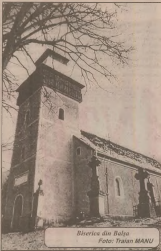
Biserica din Balșa

În satele ardelene, dar nu numai aici, bisericile sunt așezate în locuri înalte, pe ridicături de pământ în așa fel încât să fie văzute de la mari distanțe, iar dangătele clopotelor acestora să acopere suprafețe întinse. Și mai era un scop al unei astfel de amplasări: să-i anunțe pe săteni asupra unor primejdii și evenimente de interes local sau mai larg.