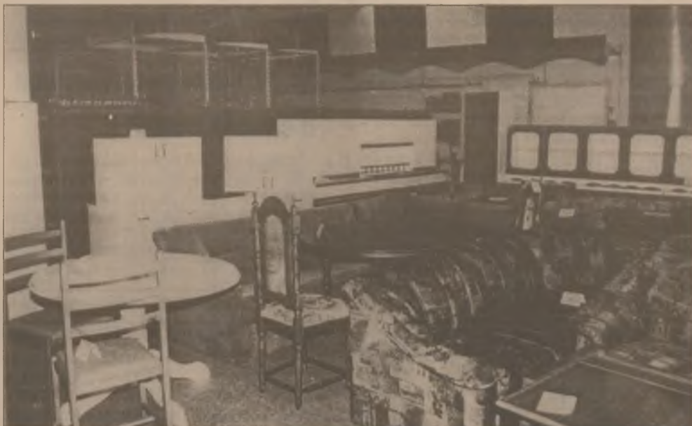
În magazinul Palia din Orăștie, firma S.C. SIMAL EXIM pune la dispoziția cumpărătorilor un bogat sortiment de mobilă