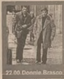
22.00 Donnie Brasco

10.00 Meciu secolului (f. animație SUA 1996) 11.30 Războinicul de pe str. Waverly (f. SF SUA '97) 13.15 Franklin (d.a) 13.45 Urmărire în viltor (thriller SUA 1992) 15.15 Pasiune incendiară (co. romantică SUA '91) 17.00 Ador încurcăturile (co. romantică SUA 1994) 19.00 Prima lovitură a lui Jackie Chan (f.a. SUA 1996) 20.30 Un puști la curtea Regelui Arthur (f.a. SUA 1995) 22.00 Donnie Brasco (dramă SUA 1997)