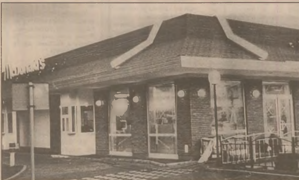
Se apropie momentul inaugurării Complexului Mc Donald's din Deva, amplasat în zona gării.