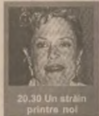
20.30 Un străin printre noi

7.00 Bună dimineața, PRO TV e al tău! 10.00 Tânăr și neliniștit (s/r) 13.00 Știrile PRO TV 13.05 Profetii despre trecut (r) 15.30 Familia Bundy (s) 16.00 Tânăr și neliniștit (s) 17.30 Știrile PRO TV 18.00 Dreptul la iubire (s) 19.30 Știrile PRO TV 20.30 Un străin printre noi (thriller SUA 1992) 22.15 Știrile PRO TV/Profit 22.30 Dharma și Greg (s ep. 9)