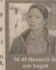
18.45 Nevastă de om bogat

10.00 Dragă, am micșorat copiii! (s) 10.45 Lumea Evei (dramă SUA 1997) 12.30 Forrest Gump (dramă SUA 1994) 15.00 Scandalul Larry Flynt (dramă SUA 1996) 17.15 Robberonii și poliția (co. SUA 1994) 18.45 Nevastă de om bogat (f. suspans SUA 1996) 20.30 Sabrina (co. romantică SUA '95) 22.45 Tinerii pistolari (w. SUA 1988) 0.30 Julian Po (dramă SUA 1997)