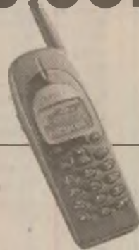
NOKIA 650 cel mai mic și compact telefon din categoria sa, numai prin TELEMobil