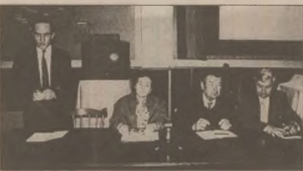
De la prezidiu se transmit mesaje de salut și succes la lucrări participanților la Simpozionul internațional "Echipamente și tehnologii pentru industria extractivă", desfășurat la CEPROMIN Deva, în zilele de 5 - 6 mai 1999