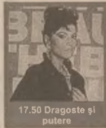
17.50 Dragoste și putere

7.00-12.15 Filme și seriale (reluări) 14.15 Maria (s) 15.00 Milady (s/r) 16.00 Guadalupe (s) 17.00 Viața noastră (s) 17.50 Dragoste și putere (s) 18.45 Înger sălbatic (s) 20.15 Celeste se întoarce (s) 21.00 Minciuna (s, ep. 41) 21.45 Milady (s) 22.45 Și vedetele se împușcă (co. SUA 1983)