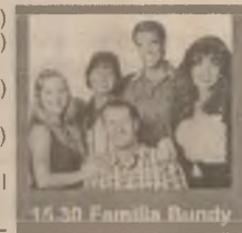
15.30 Familia Bundy

7.00 Bună dimineața, PRO TV e al tău! 10.00 Tânăr și neliniștit (s/r) 11.00 Melrose Place (s/r) 11.45 Mercenarii (s/r) 13.00 Știrile PRO TV 14.30 Planeta fantastică (s) 15.00 Oglinda timpului (s) 15.30 Familia Bundy (s) 16.00 Tânăr și neliniștit (s) 17.30 Știrile PRO TV 18.00 Dreptul la iubire (s) 19.30 Știrile PRO TV 20.30 Corbul, îngerul negru (s, ep. 7) 21.30 Alien Nation – Politistul din spațiu (f. SF SUA 1988) 23.20 Urmărire generală