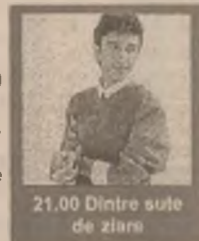
21.00 Dintre sute de ziare

7.10 Bună dimineața, România 11.00 Studioul Tudor Vornicu (r) 14.15 Cele două Diane (s) 15.05 Post Meridian 16.35 O singură viață (s) 17.30 Documentar 18.10 Dinastia (s) 19.00 Starsky și Hutch (s) 20.00 Telegurnal 20.30 Pacific Drive (s, ep. 105) 21.00 Dintre sute de ziare 22.00 Cutia Pandorei 23.00 24 din 24