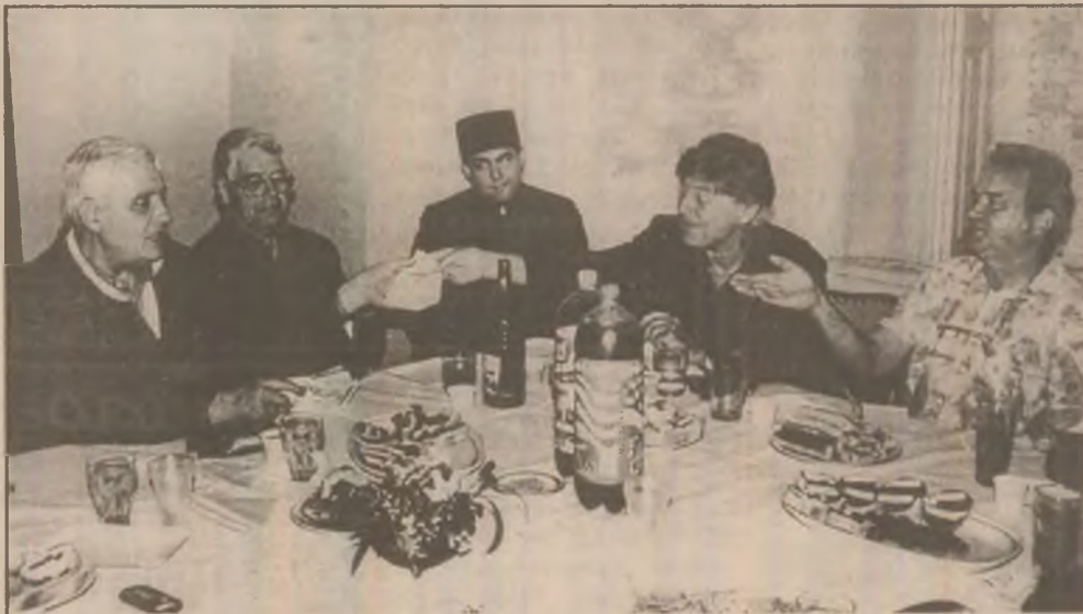
Delegația germană înmânând valuta conducerii Spitalului din Păclișa.