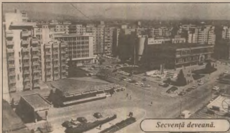
Secvență de veșnică.