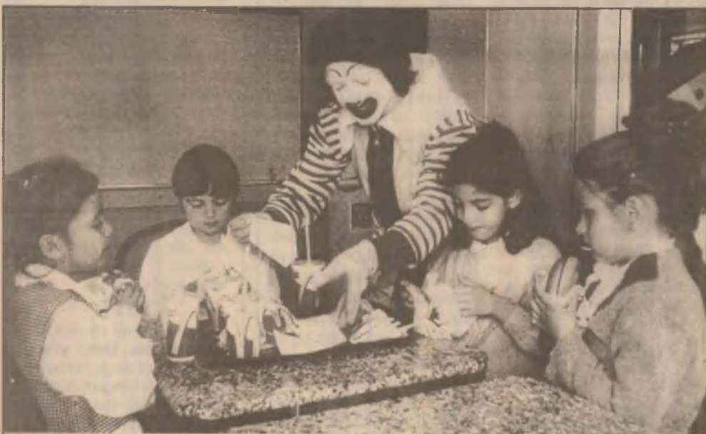
Primii "clienți" ai restaurantului au devenit prietenii lui Ronald, mascota companiei McDonald's. Deva este cel de-al șaptesprezecelea oraș cu restaurant McDonald's din țara noastră.