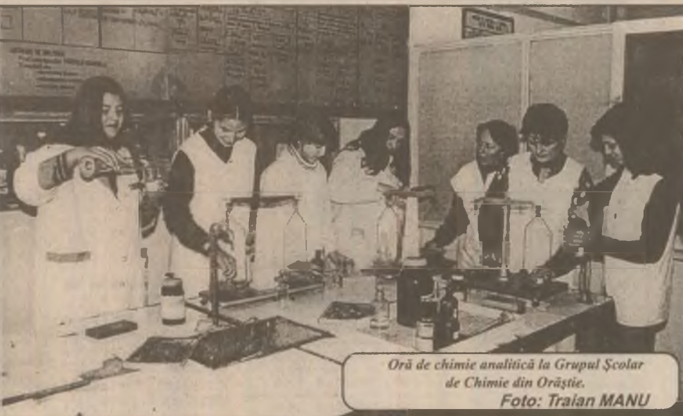
Oră de chimie analitică la Grupul Școlar de Chimie din Orăștie.

Tribunalul Hunedoara a dispus internarea infractorului într-o școală specială de reeducare.