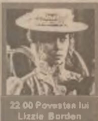
22.00 Povestea lui Lizzie Borden

8.00 Sailor Moon 9.00 Avancronică la Liga Campionilor UEFA (r) 11.00 Mapamond (r) 11.30 Teleenciclopedia (r) 13.15 Rebelul (s, ep. 57) 14.00 Emisiune în limba maghiară 15.10 Limbi străine. Germană 16.00 Grecia (s, ep. 48) 16.45 Santa Barbara (s, ep. 866) 20.10 Căsuța din prerie (s, ep. 34) 21.00 Pentru dv., doamnă! 22.00 Povestea lui Lizzie Borden (dramă SUA 1975)