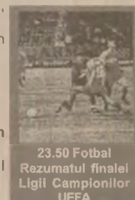
23.50 Fotbal Rezumatul finalei Ligii Campionilor UEFA

9.00 O casă la Ierusalim (do, ultima parte) 10.30 Sinasos, satul mutat (do) 11.30 TVR Cluj-Napoca 13.30 Actualitatea culturală 14.00 Trei familii (s) 16.00 Grecia (s) 16.45 Santa Barbara (s) 18.00 Documentar National Geographic 19.00 Gimnastică ritmică CE de la Budapesta (d) 20.30 Teatru TV prezintă: „Cumetrele”