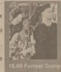
18.00 Forrest Gump

10.00 Fiul președintelui (co. SUA '96) 11.45 Santa Fe (dramă SUA 1996) 13.30 Colț Alb (f.a. SUA 1991) 15.15 Sabrina (co. romantică SUA 1995) 17.30 Totul despre sex (s. er) 18.00 Forrest Gump (dramă SUA 1994) 20.30 Steel (f. fant. SUA 1997) 22.15 Răsărit de soare (thriller SUA 1993)