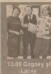
13.00 Cagney și Lacey

9.05 Demetrius și gladiatorii (f/r) 10.45 Planetele (r) 11.30 Aventuri în aer liber (r) 12.00 Misiune imposibilă (r) 13.00 Cagney și Lacey: Momentul adevărului (f.p. SUA '95) 15.00 Drumuri printre amintiri 18.00 Dinastia (s) 19.00 Aventuri la Snowy River (s) 20.35 Pacific Drive (s) 21.50 Fliera franceză (f.p. SUA 1971)