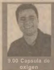
9.00 Capsula de oxigen

7.00 Ultima ediție (talkshow/r) 9.00 Capsula de oxigen 13.00 Nimeni nu e perfect (s) 15.00 Atingerea îngerilor (s) 16.00 Celebri și bogați (s) 17.00 Maria Mercedes (s) 18.00 Știri 18.50 Real TV 19.00 Camera ascunsă (div.) 19.30 Viper (s, ep. 33) 20.20 Alegeți filmul! 22.20 Știri