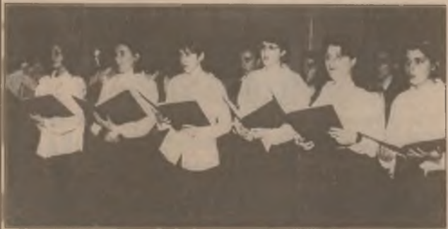
Coriste din formația "Orfeu", în timpul recitalului