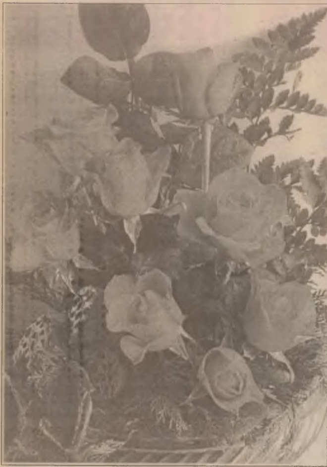
La mulți ani tuturor celor care de Sfinții Constantin și Elena își sărbătoresc onomastica!