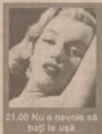
21.00 Nu e nevoie să bati la ușă

9.00 TVR Cluj-Napoca 10.05 TVR Iași 11.00 TVR Timișoara 12.05 Căsuța din prerie (s/r) 14.10 Santa Barbara (s/r) 16.00 Emisiune în limba maghiară 17.30 Familia Simpson (s, ep. 60) 18.10 Sunset Beach (s, ep. 459) 19.00 Jumătatea ta (cs) 20.00 Jurnal. Meteo. Sport. Ediție specială 21.00 Nu e nevoie să bati la ușă (thriller SUA 1952)