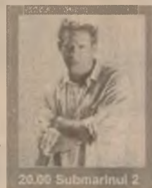
20.00 Submarinul 2

6.45 Dimineata devreme 10.00 Știri 10.20 Cafea cu parfum de femeie (s) 12.00 L.A. Doctors (s/r) 13.00 Știrile amiezii 13.15 Esmeralda (s, ep. 46) 15.00 Ape liniștite (s, ep. 49) 16.10 Luz Maria (s, ep. 20) 17.00 Știri 17.25 Camila (s, ep. 85, 83) 19.00 Observator 20.00 Submarinul 2 (f. SUA 1997) 22.15 Observator 22.45 Tucă Show