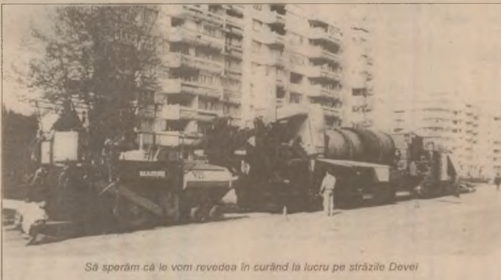
Să sperăm că le vom vedea în curând la lucru pe străzile Devei

Pagină realizată de Valentin NEAGU, Cornel POENAR, Andrei NISTOR