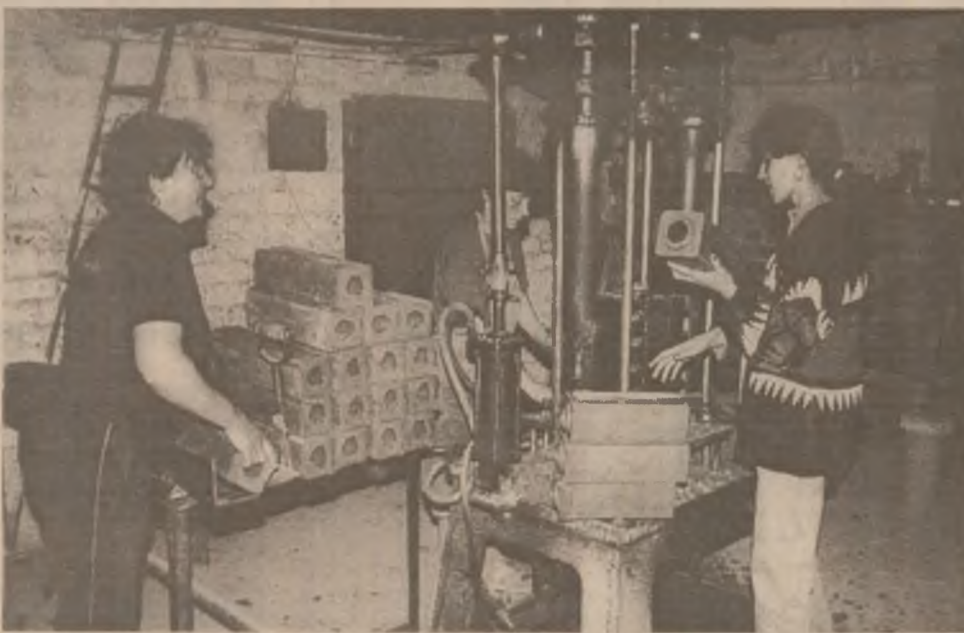
Unul dintre produsele cele mai importante, mai bune și mai eficiente realizate la SC "Refractara" SA Baru - canalele pentru podurile de turnare a oțelului. Trei muncitoare veghează la presa de execuție a produselor.