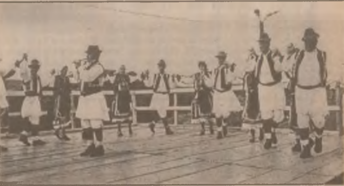
Dansatorii din Bătrâna