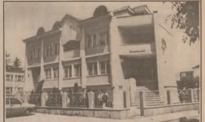
Sediul Filialei Județene din Deva a Crucii Roșii