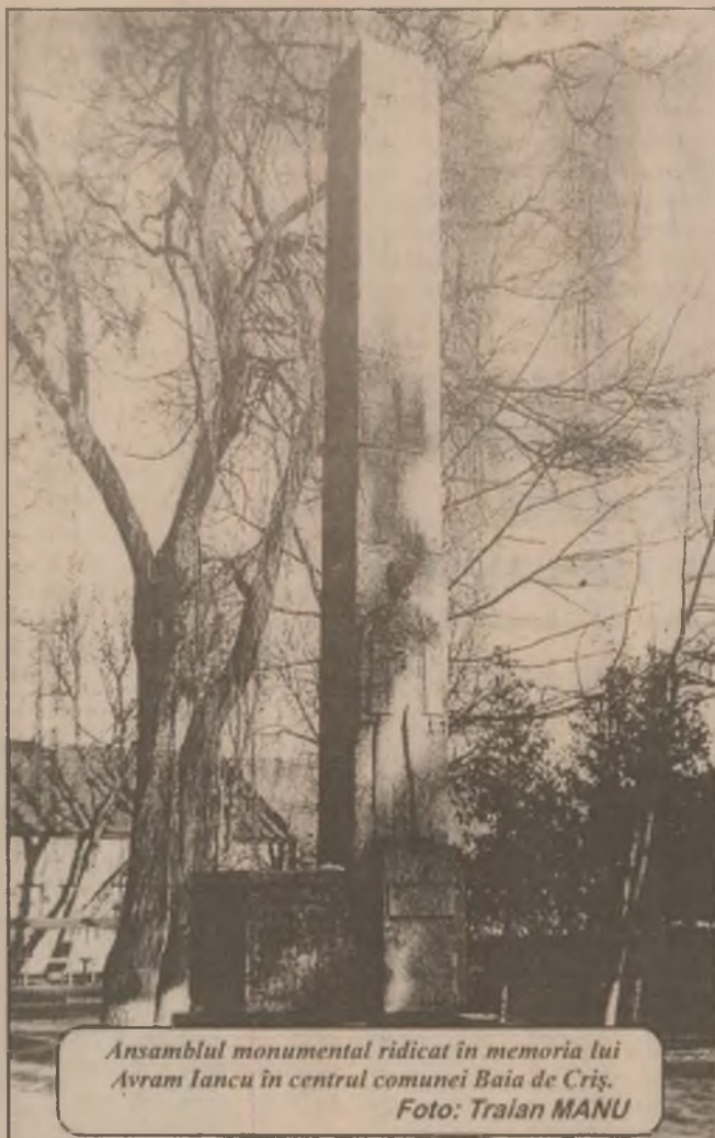
Ansamblul monumental ridicat în memoria lui Avram Iancu în centrul comunei Baia de Criș.