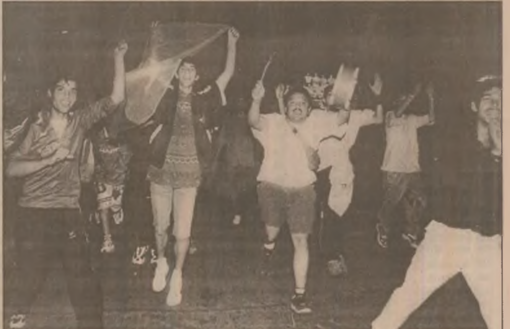
Bucurie enormă pentru români - echipa națională de fotbal a învins Ungaria cu 2-0 în preliminariile Campionatului European. Acum, parcă, sufletul nostru este mai ușor! Imaginea surprinsă târziu în noapte la Deva de fotoreporterul nostru este elocventă! (Alte amănunte în pag. a II-a)

La cererea clienților, persoane fizice, pentru depozitele pe o lună în sumă de cel puțin 2.000 -USD și 4.000 DEM se asigură capitalizarea dobânzii.