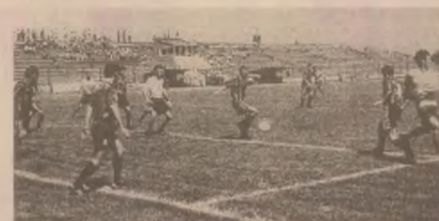
Fază din meciul Victoria Călan - Parângul Lonea.