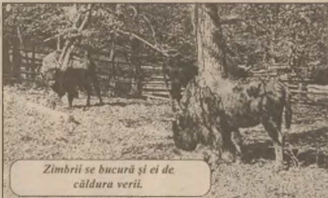
Zimbrii se bucură și ei de căldura verii.