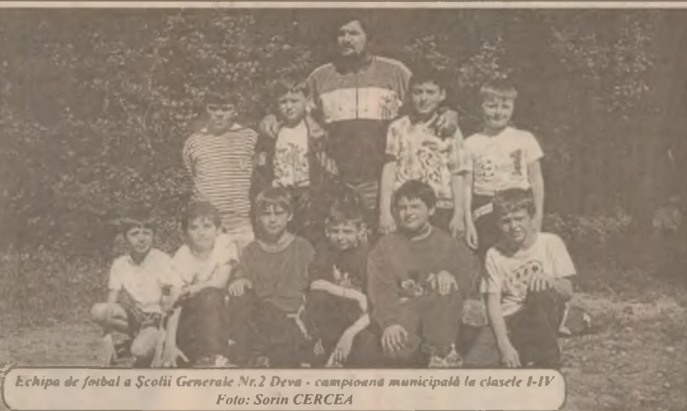
Echipa de fotbal a Școlii Generale Nr. 2 Deva - campioană municipală la clasele I-IV