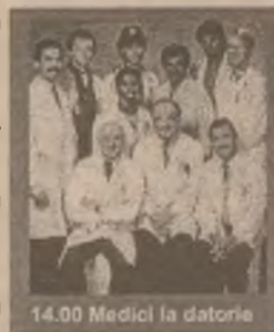
14.00 Medici la datorie

7.10 Bună dimineața, România 10.00 Știri 11.15 Studioul Tudor Vornicu (r) 14.00 Medici la datorie (s) 15.00 Știri 16.35 O singură viață (s) 17.30 Globetrotter (do) 18.00 Știri 18.10 Dinastia (s) 19.00 Secția de poliție (s) 20.35 Pacific Drive (s) 22.00 Cutia Pandorei 22.45 Clipuri muzicale