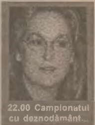
22.00 Campionatul cu deznodământ...