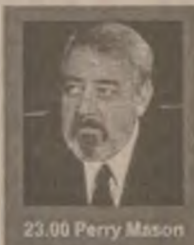
23.00 Perry Mason

7.00-12.45 Filme și seriale (reluări) 13.30 Maria (s) 14.15 I se spunea Calul (r) 16.00 Guadalupe (s) 17.00 Celeste se întoarce (s) 18.00 Dragoste și putere (s) 18.45 Căsuța poveștilor 19.30 Viața noastră (s) 20.15 Înger sălbatic (s) 21.15 Minciuna (s, ep. 77) 22.00 Milady (s) 23.00 Perry Mason: Cazul reporterului (f.p. SUA 1990)