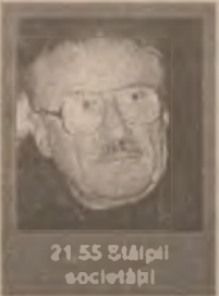
21.55 Stălpil societății