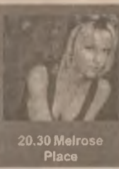
20.30 Melrose Place