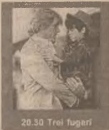
20.30 Trei fugari

10.00 Mr. Jones (dramă SUA 1995) 12.00 Călător prin timp (dramă SUA '94) 14.00 Steel (f.a. SUA 1997) 15.30 Cei mai buni (docu-dramă SUA 1996) 17.15 Un puști la curtea lui Aladdin (f.a. SUA 1997) 18.45 Suspiciune (thriller SUA '91) 20.30 Trei fugari (co. SUA 1989) 22.15 Stargate (s) 23.00 Olivert Twist (dramă SUA '97)