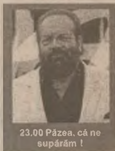
23.00 Păzea, că ne supărăm!

7.00-12.45 Filme și seriale (reluări) 13.30 Maria (s) 14.15 Dogpound Shuffle (r) 16.00 Guadalupe (s) 17.00 Celeste se întoarce (s) 18.00 Dragoste și putere (s) 18.45 Căsuța poveștilor 19.30 Viața noastră (s) 20.15 Înger sălbatic (s) 21.15 Minciuna (s, ep. 75) 22.00 Milady (s) 23.00 Păzea, că ne supărăm! (f.a., 1978)