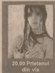
20.00 Prietenul din vis