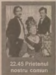
22.45 Prietenul nostru comun