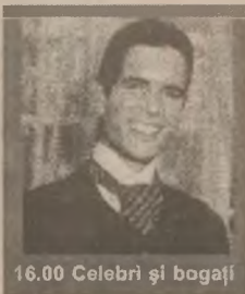
16.00 Celebri și bogați

7.00 Sport Magazin 8.30 Motor Plus (r) 9.00 Capsula de oxigen 13.00 Nimeni nu e perfect (s) 14.00 Jerry Springer Show 15.00 Pretutindeni cu tine (s) 16.00 Celebri și bogați (s) 17.00 Maria Mercedes (s)