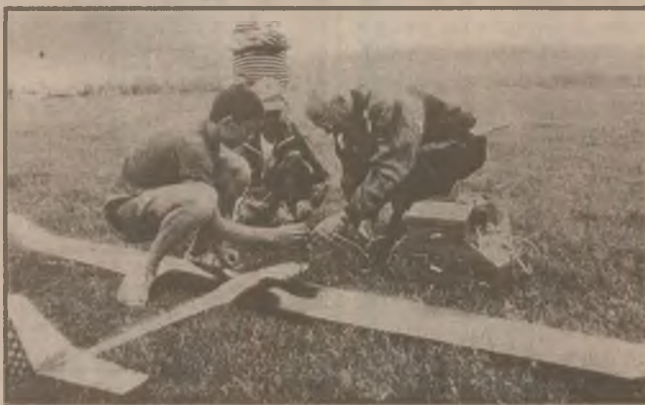
Pregătiri înaintea startului la aeromodelism.

Fotbalul a intrat în vacanță, dar asta nu înseamnă că activitatea la cluburi a încetat, dimpotrivă, preocupările conducătorilor asociațiilor privind activitatea de viitor a fotbalistilor care vor să se transfere la alte echipe se află pe multe agende de lucru. ● Conducerea cluburilor FC Köln și VfL Wolfsburg asupra sumei de transfer al lui Dorinel Munteanu la VfL. Este vorba de 2-2,5 milioane DM. ● În jurul datei de 20 iunie, la Petrolul este așteptat un impresar chinez pentru transferarea unor jucători prahoveni la trupa "galben albastră". Petrolistii mai au ceva oferte și din Grecia. ● Lobonț este unul dintre cei mai curțați fotbalști români. După ofertele din Italia și Olanda, Bogdan Lobonț a mai primit o invitație și din Anglia. Clubul Rapid cere 5 milioane de dolari pentru un eventual transfer al ex-hunedoreanului Lobonț.