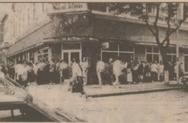
Coadă mare la plata impozitelor în Deva! De ce oare unii lasă totul pe ultimele două zile de achitare nemajorată?!