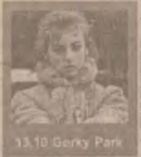
13.10 Gorky Park

7.00 Bună dimineața, PRO TV e al tău! 10.00 Tânăr și neliniștit (s/r) 13.10 Parcul Gorki (f/r) 14.30 Oglinda timpului (s) 15.05 Familia Bundy (s) 16.15 Tânăr și neliniștit (s) 17.00 Știrile PRO TV 17.30 Aripile pasiunii (s. ep. 17) 18.15 Inimă de țigancă (s. ep. 17) 19.30 Știrile PRO TV 20.30 Renegatul (s. ep. 9) 21.30 Walker, polițist texan (s. ep. 4) 22.15 Știrile PRO TV 22.30 Prietenii tăi (s. ep. 45) 23.00 Dosarele X (s)