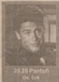
20.20 Pantofi de lux

9.00 Capsula de oxigen 13.00 Nimeni nu e perfect (s) 14.00 Jerry Springer Show 15.00 Pretutindeni cu tine (s) 16.00 Celebri și bogați (s) 17.00 Maria Mercedes (s) 18.00 Știri 19.00 Camera ascunsă (div.) 19.30 Viper (s, ep. 58) 20.20 Pantofi de lux (co. SUA/Franța 1990) 22.10 Real TV