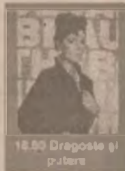
18.50 Dragoste și putere

7.00-12.45 Filme și seriale (reluări) 13.30 Maria (s) 14.30 Trandafirul roșu din Cairo (r) 16.00 Guadalupe (s) 17.00 Celeste se întoarce (s) 18.00 Dragoste și putere (s) 18.45 Căsuța poveștilor (s) 19.30 Viața noastră (s) 20.15 Înger sălbatic (s, rezumatul săptămânii) 21.15 Minciuna (s, ep. 86) 22.00 Milady (s) 23.00 40° la umbră (dramă SUA/Anglia 1975)