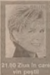
21.00 Ziua în care vin peștii

9.00 TVR Cluj-Napoca 10.05 TVR Iași 11.00 TVR Timișoara 12.05 Căsuța din prerie (s/r) 14.10 Santa Barbara (s/r) 16.00 Emisiune în limba maghiară 17.30 Familia Simpson (s. da) 18.10 Sunset Beach (s. ep. 473) 19.00 Jumătatea ta (cs) 20.00 Jurnal. Meteo. Sport 21.00 Ziua în care vin peștii (co. Ger./Anglia/Grecia 1967) 23.00 Jurnalul de noapte. Sport