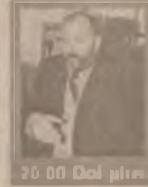
20.00 Doi plus unu

6.45 Dimineața devreme 10.20 Cafea cu parfum de femeie (s) 13.00 Știrile amiezii 13.15 Esmeralda (s. ep. 58) 15.00 Ape liniștite (s. ep. 62) 16.10 Luz Maria (s. ep. 33) 17.00 Știri 17.25 Leonela (s. ep. 39, 40) 19.00 Observator 20.00 Doi plus unu 20.30 Pericol iminent (s. ep. 35) 21.20 Raven (s. ep. 12) 22.45 Marius Tucă Show