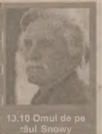
13.10 Omul de pe râul Snowy

7.00 Bună dimineața, PRO TV e al tău! 10.00 Tânăr și neliniștit (r) 13.00 Știrile PRO TV 13.10 Omul de pe râul Snowy (r) 15.00 Familia Bundy (s) 16.15 Tânăr și neliniștit (s) 17.30 Aripile pasiunii (s. ep. 19) 18.30 Inimă de țigancă (s. ep. 19) 19.30 Știrile PRO TV 20.30 Melrose Place (s. ep. 131) 21.30 Mercenarii (s. ep. 21) 22.15 Știrile PRO TV 22.30 Prietenii tăi (s. ep. 47)