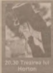
20.30 Trezirea lui Horton

10.00 Alergătoarea (dramă SUA '96) 11.30 Zona de impact (thriller SUA 1993) 13.15 American Perfekt (dramă SUA 1997) 15.00 Foamea (s) 15.30 Cimitirul viu (horror SUA 1998) 17.00 Tatăl miresei 2 (co. SUA 1995) 18.45 Jaful (thriller SUA 1996) 20.30 Trezirea lui Horton (f. familie SUA 1997) 22.00 Frankenstein (horror SUA 1994)