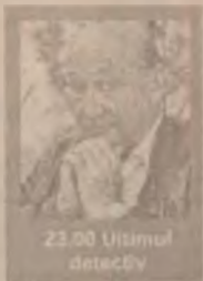
23.00 Ultimul detectiv

7.00-12.45 Filme și seriale (reluări) 13.30 Maria (s) 14.15 Cândva, undeva (r) 16.00 Guadalupe (s) 17.00 Celeste se întoarce (s) 18.45 Căsuța poveștilor 19.30 Viața noastră (s) 20.15 Înger sălbatic (s) 21.15 Minciuna (s, ep. 81) 22.00 Milady (s) 23.00 Ultimul detectiv (SF SUA 1982)