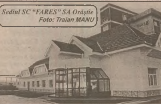
Sediul SC „FARES” SA Orăștie