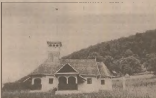
Biserica ortodoxă din Bulzeștii de Jos, una din cele 6 biserici ale comunei