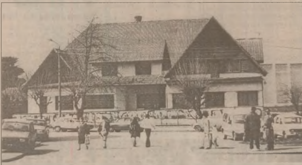
Muzeul aurului din Brad, locul unde se păstrează comorile mineritului din zona Bradului și din țară