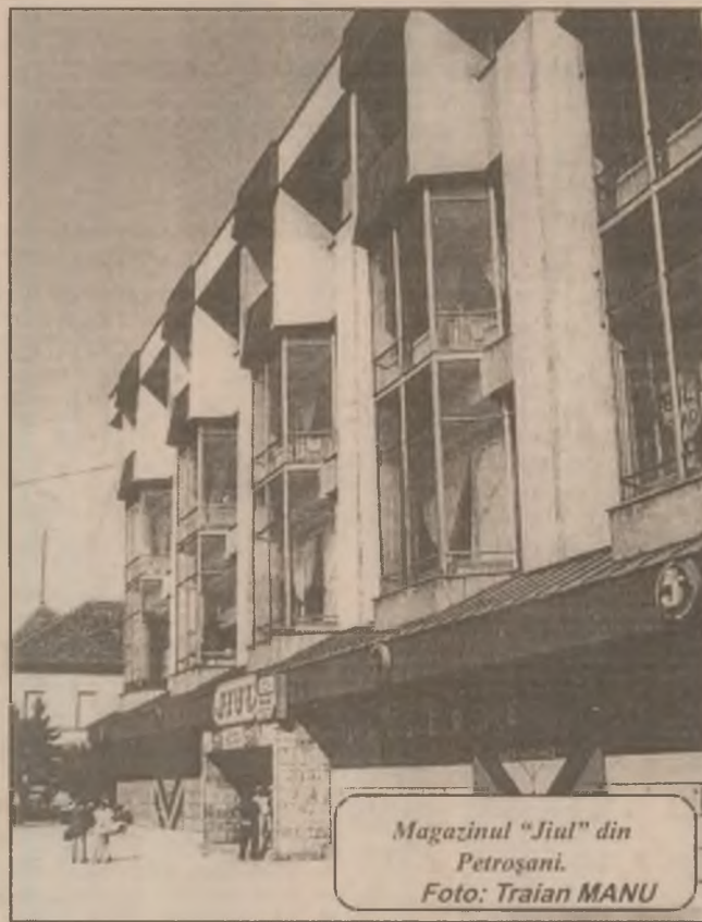
Magazinul "Jiul" din Petroșani.

către dl Mihai Blânda. La vernisajul expoziției au participat elevi, părinți, cadre didactice, alte personalități ale orașului. Pe parcursul celor 4 zile, alte zeci de elevi și părinți au vizitat expoziția, unică în felul său până la această dată în oraș. (M.B.)