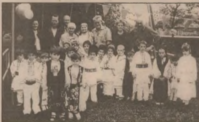
Membrii Fundației "Înfrățiți pentru Sarmizegetusa" alături de "beneficiarii" donațiilor, la inaugurarea spațiului de joacă al grădiniței.