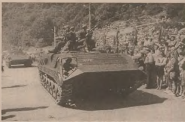
Tehnica militară în acțiune la Dupăpiatră

Cu ocazia fericită a aniversării celor 30 de ani ai Batalionului 26 UM "Zarand" Brad se cuvine să menționăm la loc de onoare numele distinșilor comandanți superiori - fără aprobarea cărora nu s-ar fi putut