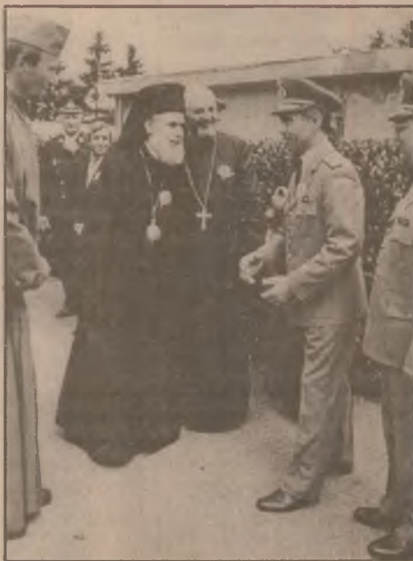
Armata și biserica. Pavăze ale existenței românilor de pretutindeni.

Iată ce a spus între altele dl. Constantin Degeratu: „Dragi prieteni, pe cei care îi mai cunosc, sau pe cei despre care îmi reamintesc. Iertați-mi emoțiile. Dar sunt 30 de ani de realizări, de împliniri, 30 de ani de griji pentru țară, 30 de ani de griji pentru oamenii unității. Pentru toate acestea nu putem să spunem decât „mulțumesc”. Armata română trăiește vremuri grele. Totuși „eu cred în destinul unității noastre”, a ținut să precizeze comandantul armatei române.