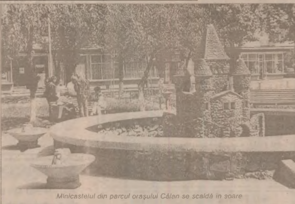
Minicastele din parcul orașului Călan se scaldă în soare

Pagină realizată de Valentin NEAGU, Cornel POENAR