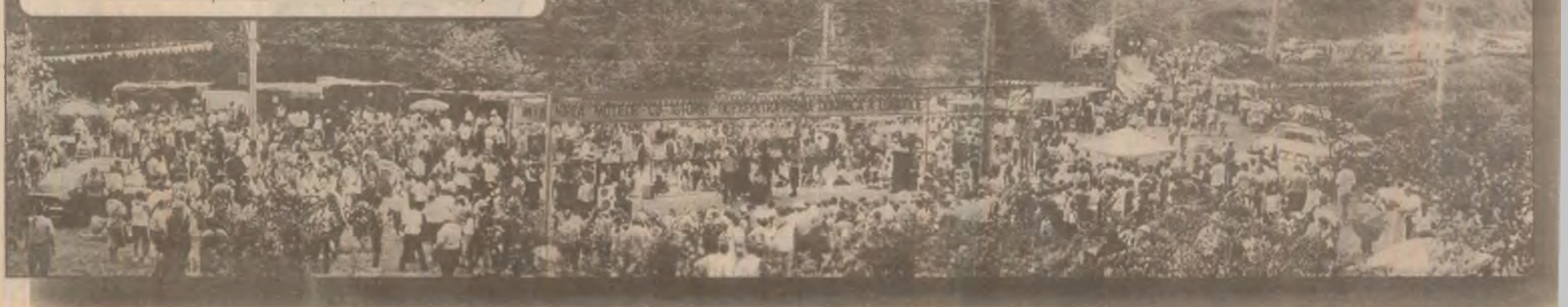
Aspect de ansamblu de la Dupăpiatră din timpul desfășurării „Întâlnirii moșilor cu istoria” (ediția a XXVII-a)

A fost un moment de penibilitate pe care cei prezenți l-au dezaprobat. În cele din urmă, combatanții și-au dat mâna la aceeași masă.