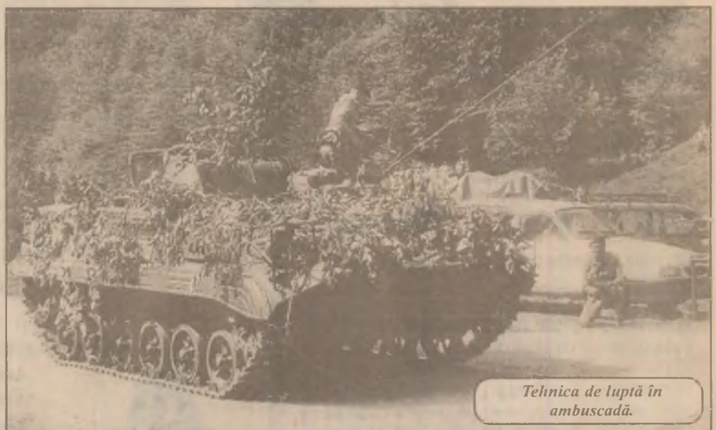
Tehnica de luptă în ambuscadă.