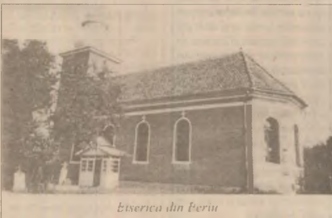
Biserica din Beriu

Din păcate situația tristă a agriculturii se răsfărânge și asupra sectorului de creștere a animalelor. În ultimii ani efectivul de animale este într-o continuă reducere, mulți oameni renunțând să mai crească animale pentru valorificare (vânzare) și limitându-se la asigurarea nevoilor proprii.