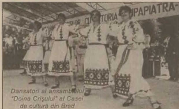
Dansatori ai ansamblului "Doina Crișului" al Casei de cultură din Brad