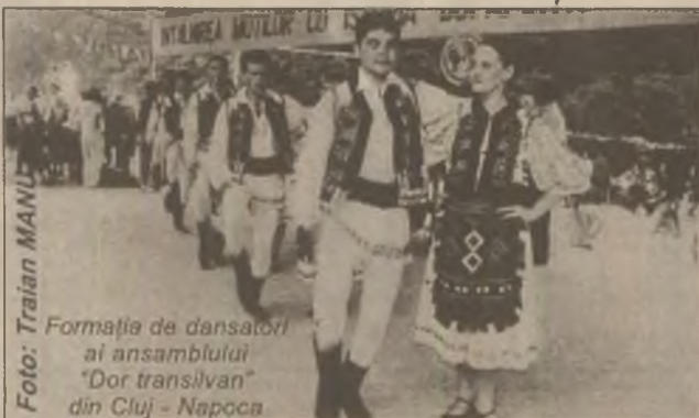
Formația de dansatori ai ansamblului "Dor transilvan" din Cluj - Napoca