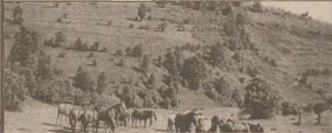
De pitorescul peisajului de la Bunila se bucură doar... caili, turiștii ocolind această zonă din cauza dificultăților de acces generate de starea deplorabilă a drumurilor.

Chiar și unii dintre cei bătrâni și-au cumpărat case la șes, venind aici sus la Alun doar două-trei luni în timpul verii. Clădirea