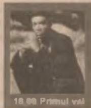
18.00 Primul val