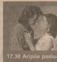
17.30 Aripile pasiunii