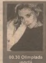
00.30 Olimpiada morții