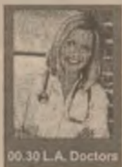
00.30 L.A. Doctors