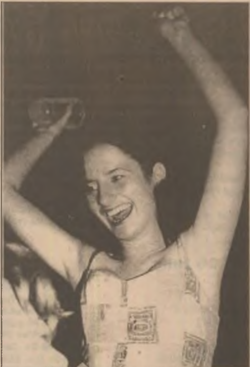
Bucuria victoriei se poate manifesta și la un concurs de băut bere!