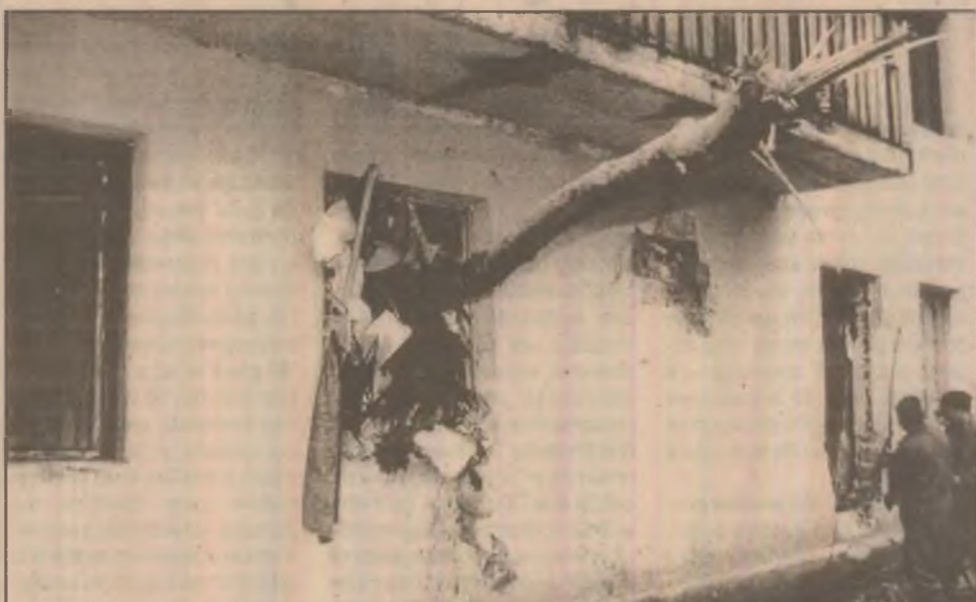
Imagini de coșmar. Un copac de 15 metri lungime a străpuns zidurile clădirii, trecând prin două apartamente, producând victime și mari pagube materiale.