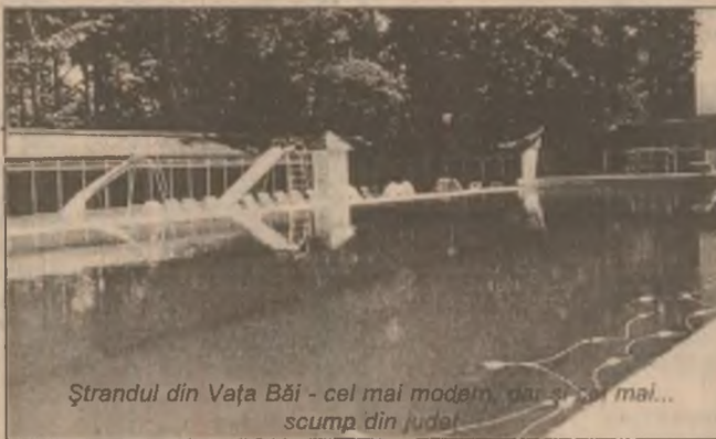
Ștrandul din Vața Băi - cel mai modern, dar și cel mai... scump din județ.

O sută, o mie sau chiar 10.000 de lei nu mai reprezintă mare lucru în ziua de astăzi. Dar... 40.000 lei constituie totuși 10 la sută din salariul minim pe economie, contravaloarea a 20 de pâini, prețul a cel puțin cinci beri sau costul a vreo 8-10 caiete școlare etc. Pentru locuitorii comunei Vața de Jos 40.000 lei pot reprezenta costul a peste 20 litri de lapte, prețul a vreo 10-12 kg de brânză, sau a aproximativ 15 kg de cartofi. Or, "valoarea" unui bilet de intrare la ștrandul "Superelegant" amenajat de Romtelecom. Calculând în astfel de produse "agro-alimentare" - apreciem că prețul unei bălăceli în ștrandul local e cam piperat pentru "țărani" din Vața de Jos. Pe de altă parte, calculând în impulsuri telefonice (care se scumpește la 2-3 luni) poate că prețul e rezonabil. În aceste condiții ne întrebăm pentru cine o fi ștrandul din Vața de Jos, pentru "țărani locali" sau pentru "telefoniștii cu funcții"?