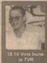
18.10 Voie bună la TVR