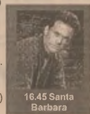
16.45 Santa Barbara