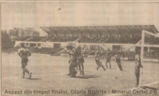
Aspect din timpul finalei, Gloria Bistrița - Minerul Certej 2-0