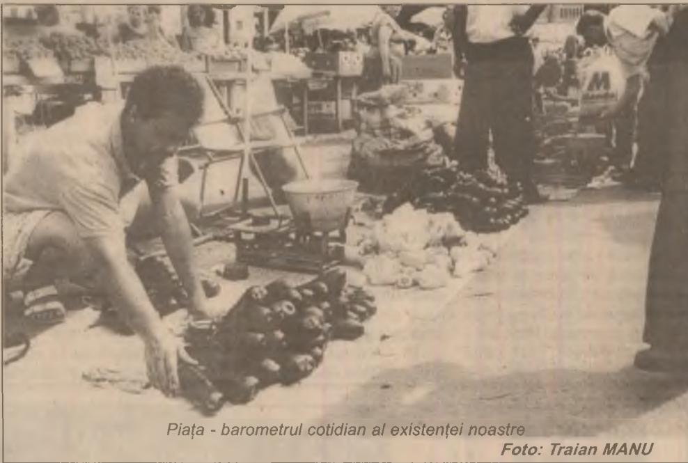
Piața - barometrul cotidian al existenței noastre

Energia electrică și gazele au înregistrat, în iunie, cele mai mari scumpiri pe ansamblul grupei de mărfuri nealimentare. Tarifele la energia electrică s-au majorat cu 33,1%, iar cele la gaze - cu 56,5% ș.a.