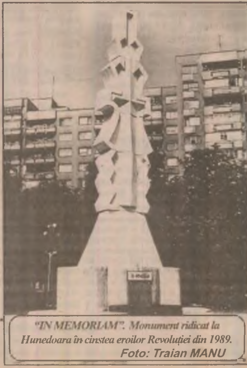
“IN MEMORIAM”. Monument ridicat la Hunedoara în cinstea eroilor Revoluției din 1989.