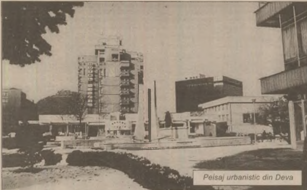
Peisaj urbanistic din Deva

Prin această nouă metodă, care presupune o investiție de aproximativ 10.000 de dolari, se dă o notă mult mai lucrativă în cadrul ședințelor de consiliu, iar eroarea de înregistrare a punctelor de vedere exprimate de vorbitori este minimă.