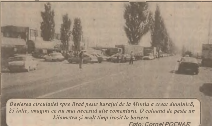
Devierea circulației spre Brad peste barajul de la Mintia a creat duminică, 25 iulie, imagini ce nu mai necesită alte comentarii. O coloană de peste un kilometru și mult timp irosit la barieră.