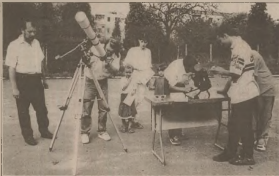
Caravana eclipsei la Deva, în cadrul acțiunii de popularizare a evenimentului astronomic din 11 august