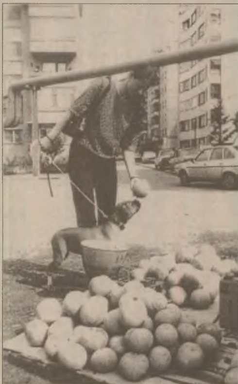
Parfumul pepenilor verzi atrage și pe prietenul nostru cel mai bun

Adulții care au studiat muzica înainte de vârsta de 12 ani sunt norocoși. Memoria lor auditivă este în mod sigur mai bună decât a celorlalți. Se cunoaște că, la muzicieni, aria cerebrală numită lobul temporal stâng este mai voluminoasă, mai dezvoltată. Tot aici sunt localizate mecanismele memoriei auditive. Cercetătorii universității din Hong-Kong au vrut să afle dacă există o legătură între dezvoltarea lobului temporal și funcțiile cognitive amplificate numai la muzicieni. Psihologii au făcut un test pe 60 de subiecți, din care 30 studiaseră muzica în copilărie. Fiecare participant a fost supus la două probe, una pentru memoria auditivă și alta pentru memoria vizuală. La testul de memorie auditivă muzicienii bineînțeles că au excelat. În schimb, performanțele obținute la al doilea test erau comparabile, între cele două grupe. Aceste rezultate arată că educația muzicală precoce ascute și stimulează permanent memoria auditivă.