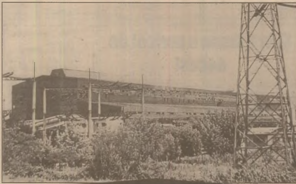
Oțelăria electrică nr. 2 de la Siderurgica Hunedoara "se încălzește" pentru a putea produce cantități sporite de oțel.

La 31 decembrie 1998, datoria externă a României era de 9 miliarde de dolari. În primele patru luni din 1999 au fost plătite 1,1 miliarde de dolari, iar până la sfârșitul anului vor mai fi plătite 400 de milioane, încât la 31 decembrie a.c. datoria externă să scadă la 7,5 miliarde de dolari.