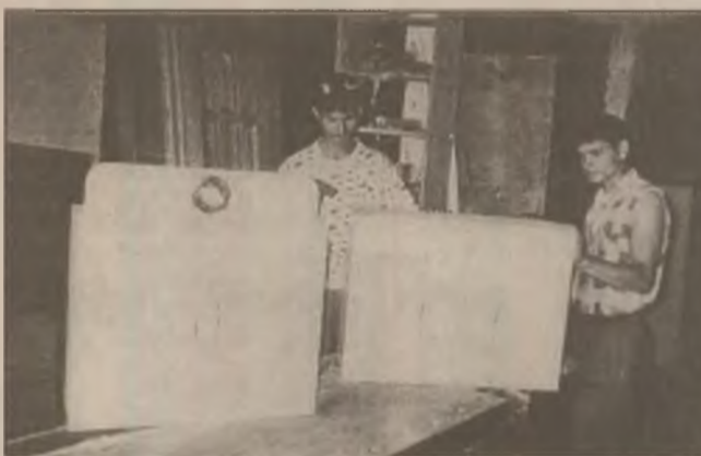
La Turdaș, din lemn se realizează mobilier, uși, ferestre de o calitate foarte bună. Sunt primii pași într-o activitate nouă ce aduce mari speranțe și noi locuri de muncă.

În acest context, oamenii consideră că se impune înființarea unei asociații județene sau regionale de profil, cu scopul de a promova o politică agricolă care să protejeze micul producător prin măsuri protecționiste și diminuarea pe cât posibil a importului de produse agricole. În caz contrar, Turdășana va rămâne în curând doar o frumoasă amintire.