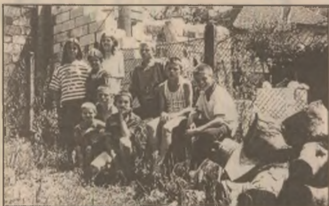
Copiii de la Orfelinatul Emanuel din Crișcior se bucură de vacanță și soare.

Pe perioada vacanței, copiilor li se asigură un program special asemănător cu o vacanță la țară la bunici. În gospodăria anexă a orfelinatului au fost aduse animale, copiii ocupându-se mai mult sub forma jocului de porci, iepuri, găște, găini și porumbei.