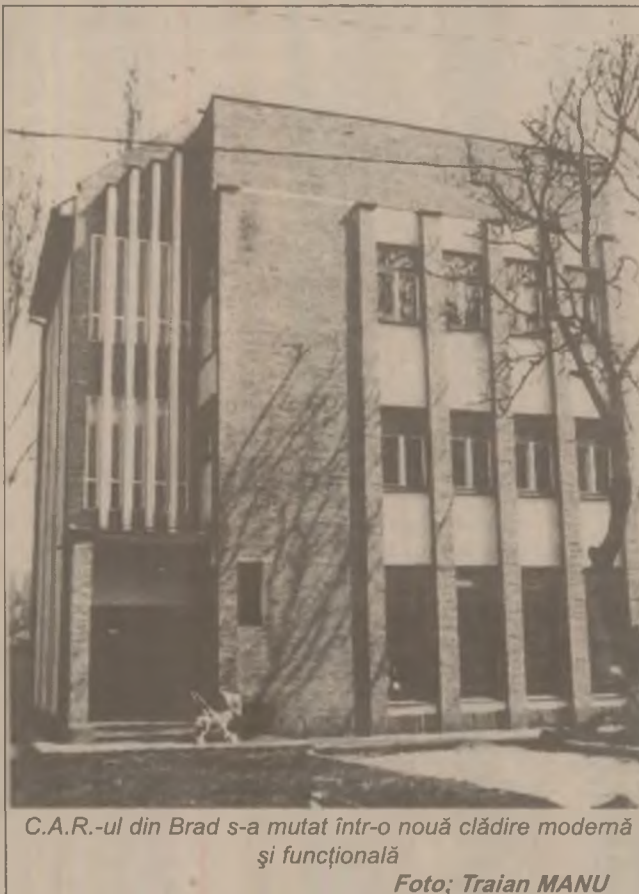
C.A.R.-ul din Brad s-a mutat într-o nouă clădire modernă și funcțională