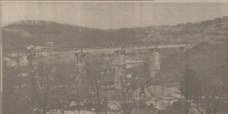
VĂLIȘOARA. Viaductul de cale ferată care făcea legătura între Deva și Brad