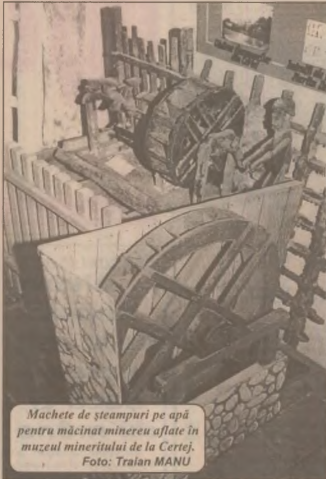
Machete de șteampuri pe apă pentru măcinat minereu aflate în muzeul mineritului de la Certej.

Cu mare mâhnire, încă o dată mi-am dat seama că acest copil, din punct de vedere mental, îi moștenește cu cinste, atât pe socri cât și pe Claustrina.