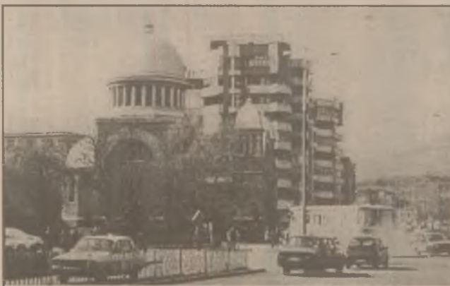
Deva cotidiană. Imagine din centrul municipiului