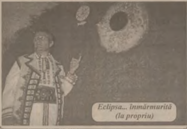
Eclipsa... înmărmurită (la propriu)

Autorul acestei creații (sfântită de preotul satului chiar în ziua eclipsei) preciza că cei care trec prin Băița vor putea să viziteze locul cu pricina, fie și dacă o fac doar din simplă curiozitate. (G.BIRLA)