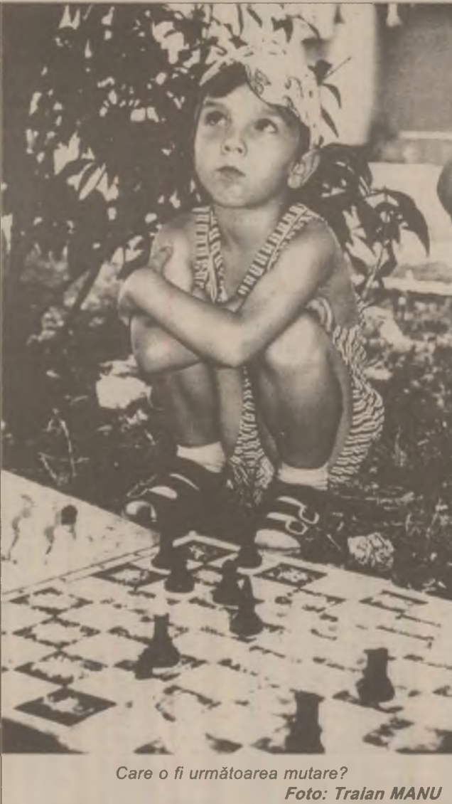
Care o fi următoarea mutare?