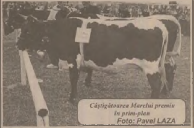
Câștigătoarea Marelui premiu în prim-plan