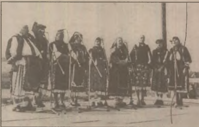
Grupul vocal din Hășdău

Sărbătoarea s-a continuat cu nedeia pădurească de la Căminul Cultural din Poienița Voinii. Din nou liniștea s-a așternut peste satul interpretului pentru încă un an. Oamenii locului, interpreți și dansatori, consacrați sau care acum încearcă să-și facă un nume, iubitori de folclor din toată țara așteaptă ediția viitoare a sărbătorii. Și cele văzute la această a V-a ediție ne fac să sperăm că "sărbătoarea pădurenilor" va dăinui atât cât vor exista pădurenii cu dragoste pentru frumusețea cântecelor, jocurilor și portului lor.