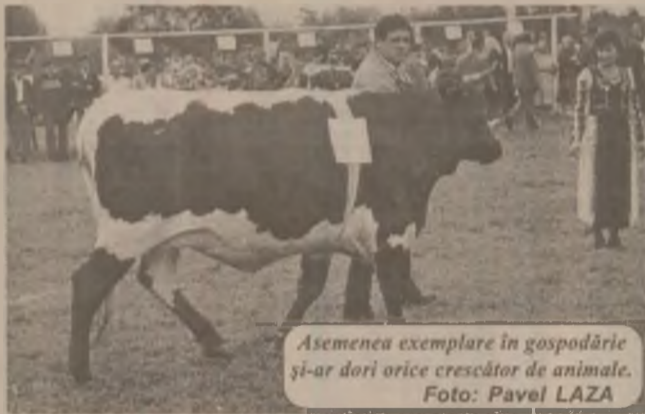
Asemenea exemplare în gospodărie și-ar dori orice crescător de animale.